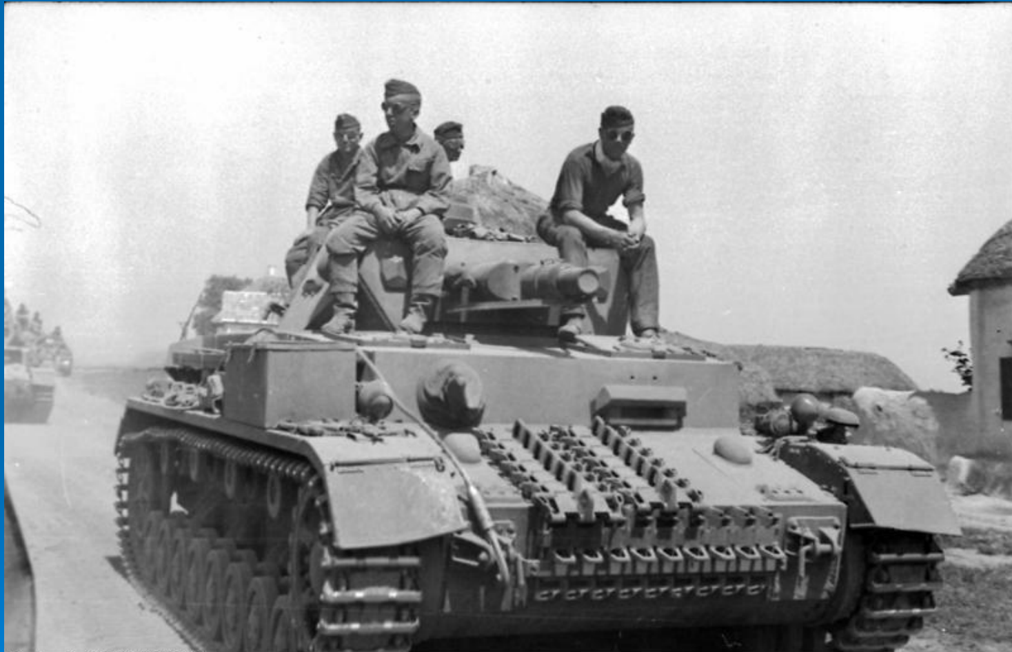
Juni 1942