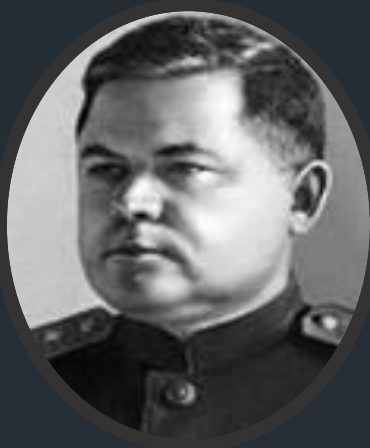
Ватутин, Николай Фёдорович