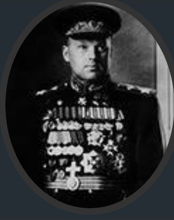
Рокоссовский, Константин Константинович