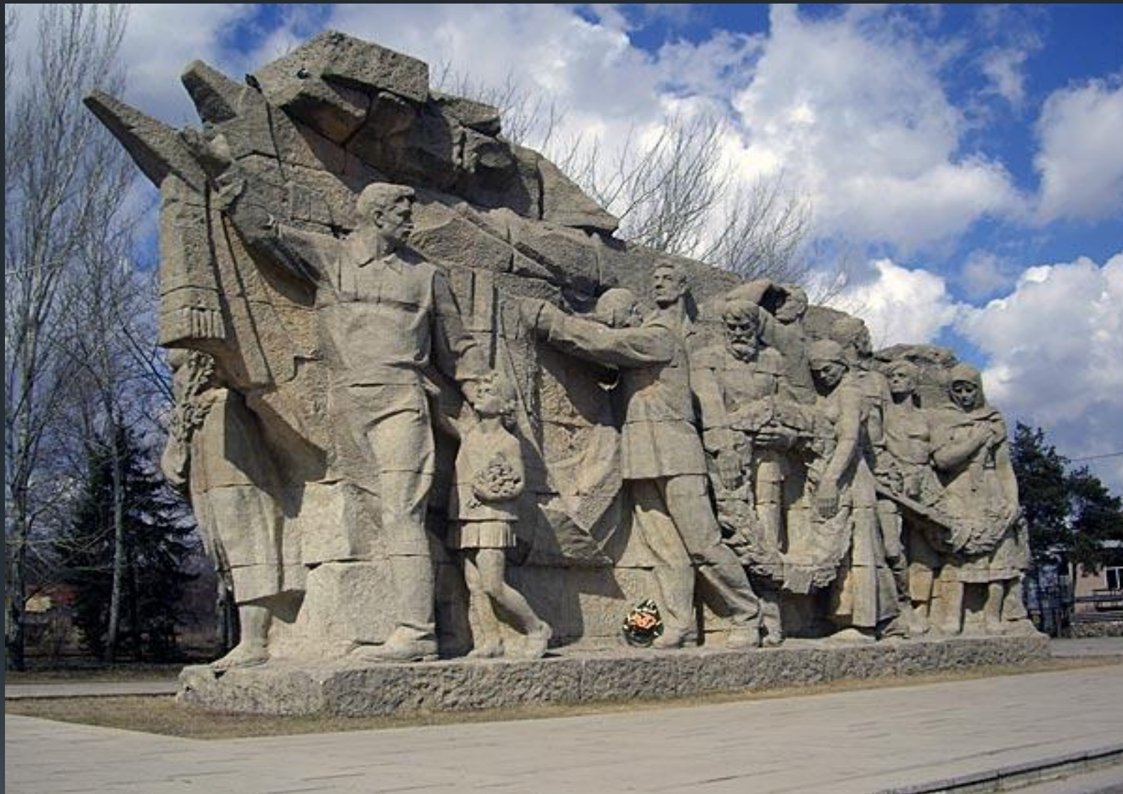
У входа на Мамаев курган. Скульптура «Память поколений».