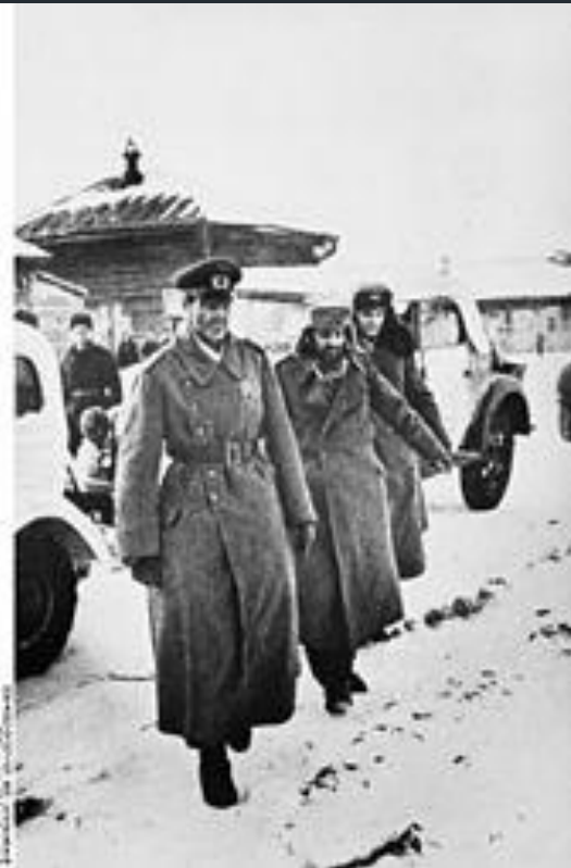
31 января 1943 г. Пленение фельдмаршала Паулюса