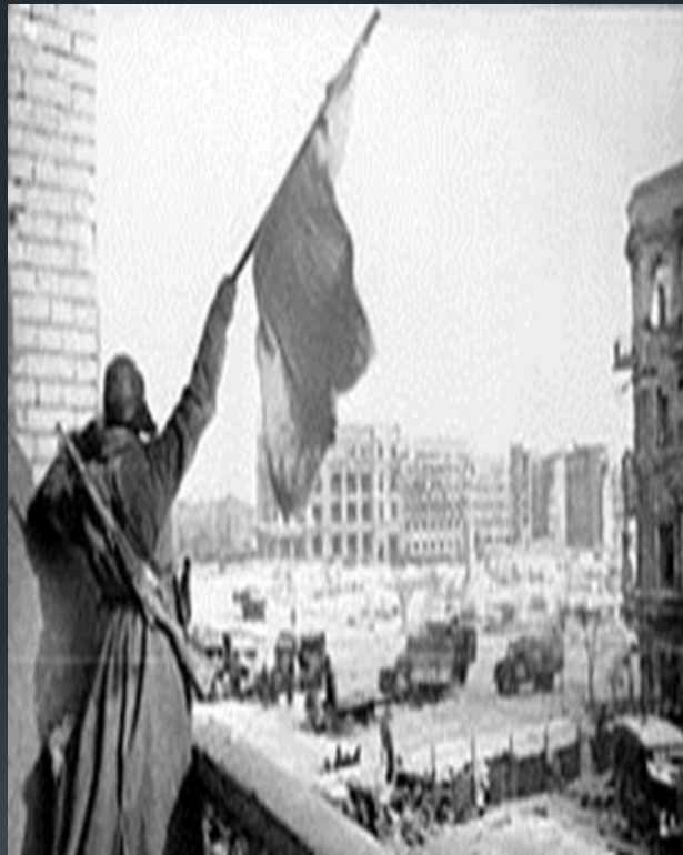
Флаг над освобождённым городом, Сталинград, 1943 год

31 января была ликвидирована южная группа, её остатки во главе с Паулюсом сдались в плен. 2 февраля было покончено с северной группой. На этом Сталинградская битва завершилась.