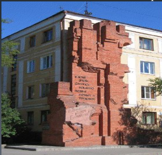
Современный вид на дом Павлова