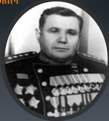
Ерёменко, Андрей Иванович

План предстоящего наступления получил кодовое название «Уран» - контрнаступление войск трёх фронтов: Юго-Западного (командующий — генерал Н. Ф. Ватутин), Сталинградского (командующий — генерал А. И. Еременко) и Донского (командующий — генерал К. К. Рокоссовский) с целью окружения и уничтожения вражеской группировки войск в районе города Сталинграда.