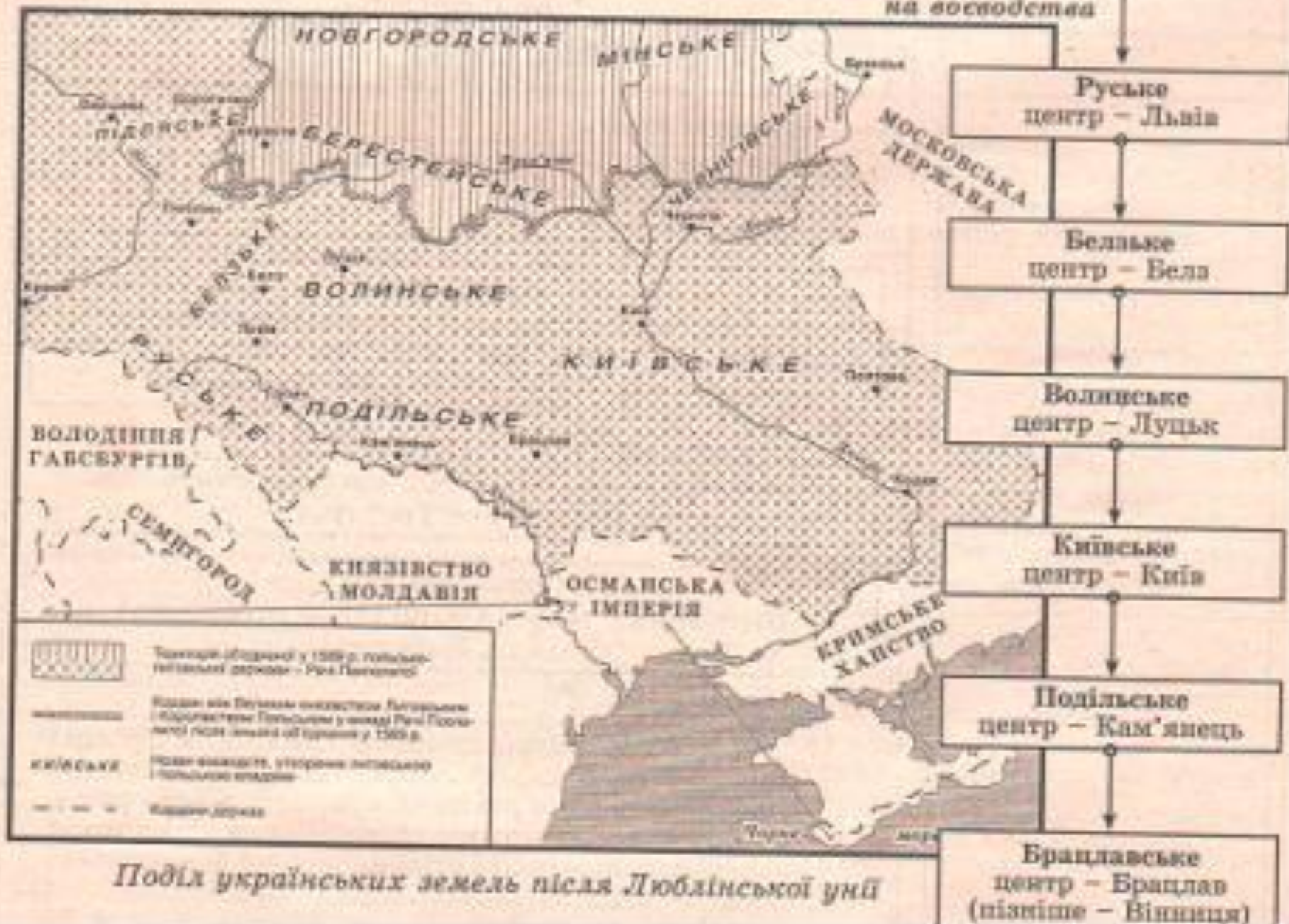
Поділ українських земель після Люблінської унії