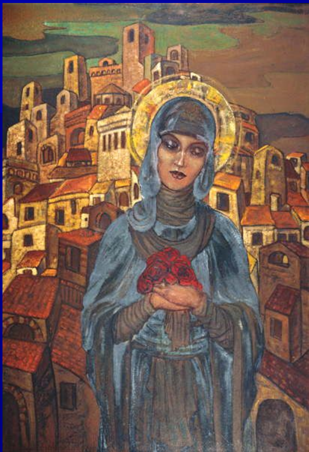
Крещение княгини Ольги

Княгиня Ольга пыталась установить добрые отношения с соседними странами и прежде всего с Византией. Она понимала, что Руси больше нельзя оставаться языческой т.к. христианские государства относятся к ней, как к «варварской», «дикой». Ольга со свитой отправилась в Константинополь и с благословения византийского императора приняла христианство и новое православное имя Елена. Она стала первой христианкой на Руси.