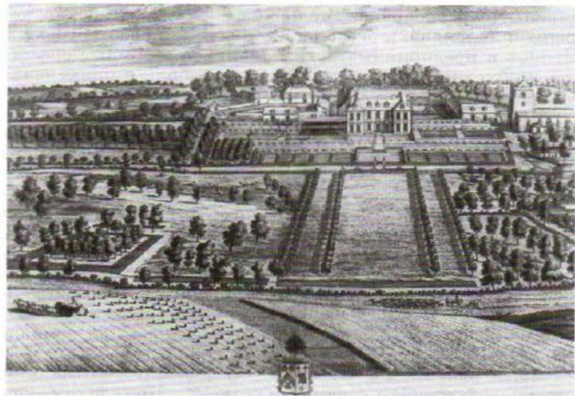
Имение крупного феодала на севере Англии. Начало XVIII в.