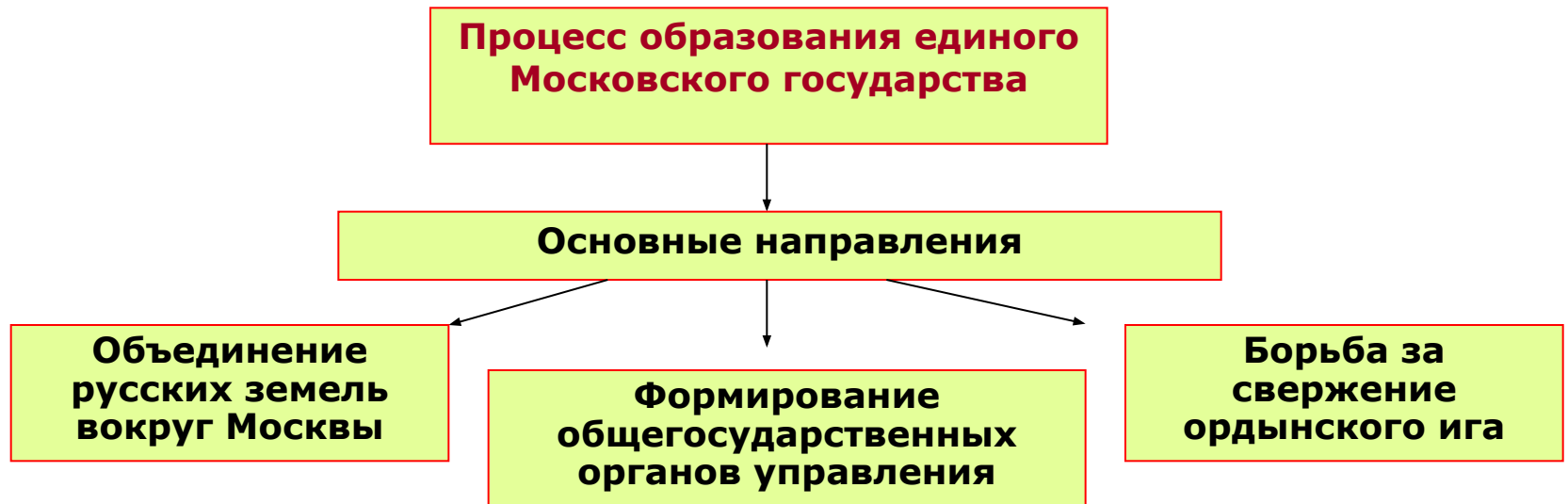
Схема 5.2. Направления и этапы процесса образования единого государства в XIV-XVI вв.