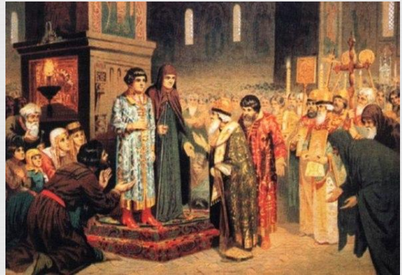
Избрание Михаила на царство

? В январе 1613 г. открылся Земский собор. Через два месяца споры вокруг претендента на престол решились в пользу Михаила Романова.