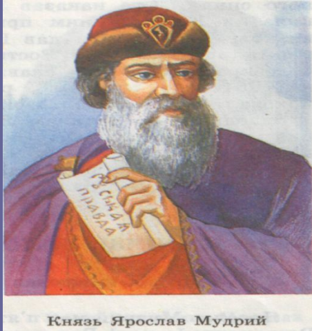
Князь Ярослав Мудрий