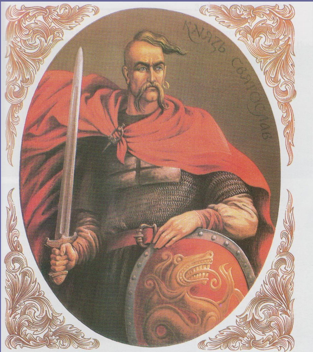
Князь Святослав. Худ. А. Штанко

Князь СВЯТОСЛАВ (964-972 pp.) "МУЖ КРОВІ"