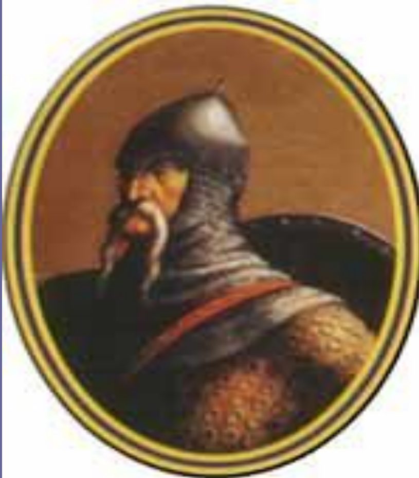
Князь ОЛЕГ (882 – 912 рр.)