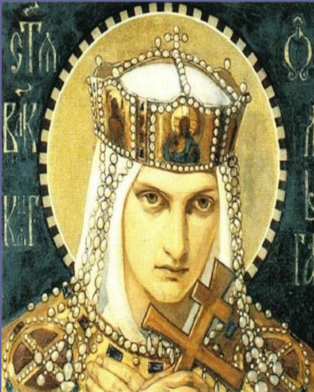
Княгиня ОЛЬГА (у святому хрещенні Олена) (945-964 рр.)