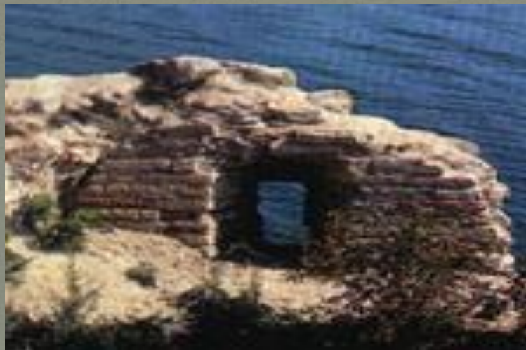
(Бойница Раскатной башни.)