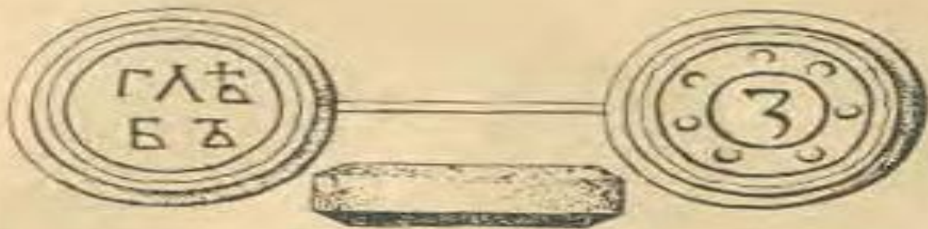
Рис. 21. Медная гирька князя Глеба для проверки веса монет.