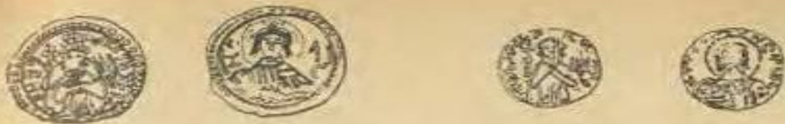
Рис. 20. Золотая монета — гиря («Златник») Владимира, XI век.

Гиря «Златник» Владимира – это золотая монета, весом 4 грамма. На лицевой стороне монеты – изображение великого князя в головном уборе с жезлом в руке и круговая надпись: «Владимир а се его злато» или «Владимир на столе». На оборотной стороне – поясное изображение с надписью «Иисус Христос». Серебряная гирька: на лицевой стороне – изображение почти такое же, как и на золотой монете и те же надписи. На оборотной стороне – окончание надписи с лицевой стороны и особый знак. Медная гирька князя Глеба (XII век), найденная в киевских пещерах при обвале стен. Вес этой гирьки 516,5 долей.