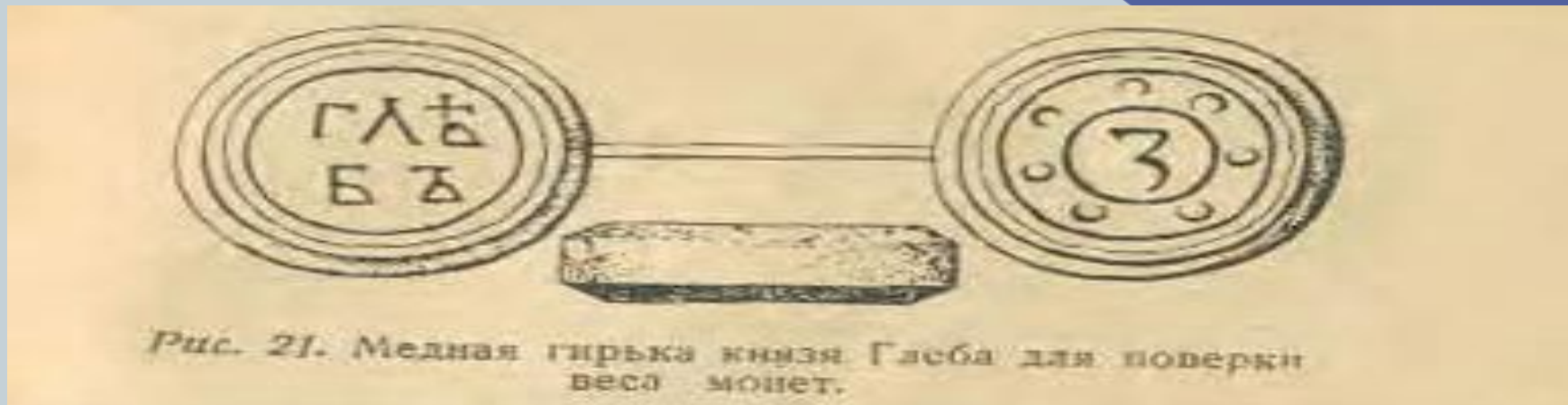
Рис. 21. Медная гирька князя Глеба для проверки веса монет.