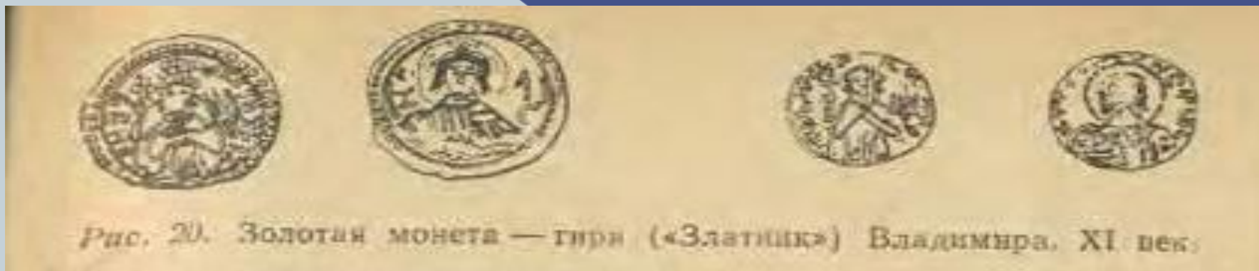
Рис. 20. Золотая монета — гиря («Златник») Владимира, XI век.

Гиря «Златник» Владимира – это золотая монета, весом 4 грамма. На лицевой стороне монеты – изображение великого князя в головном уборе с жезлом в руке и круговая надпись: «Владимир а се его злато» или «Владимир на столе». На оборотной стороне – поясное изображение с надписью «Иисус Христос». Серебряная гирька: на лицевой стороне – изображение почти такое же, как и на золотой монете и те же надписи. На оборотной стороне – окончание надписи с лицевой стороны и особый знак. Медная гирька князя Глеба (XII век), найденная в киевских пещерах при обвале стен. Вес этой гирьки 516,5 долей.