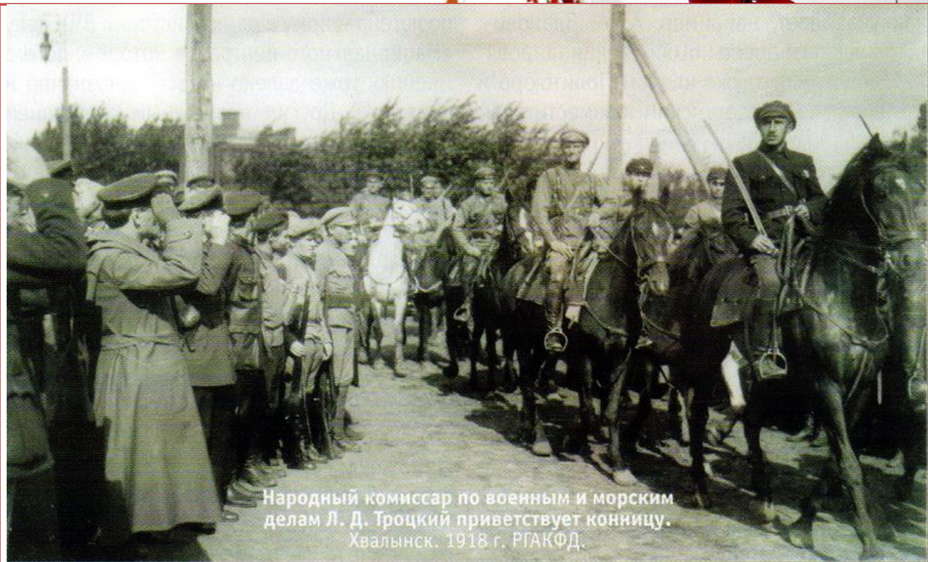
Народный комиссар по военным и морским делам Л. Д. Троцкий приветствует конницу. Хвалынск. 1918 г.