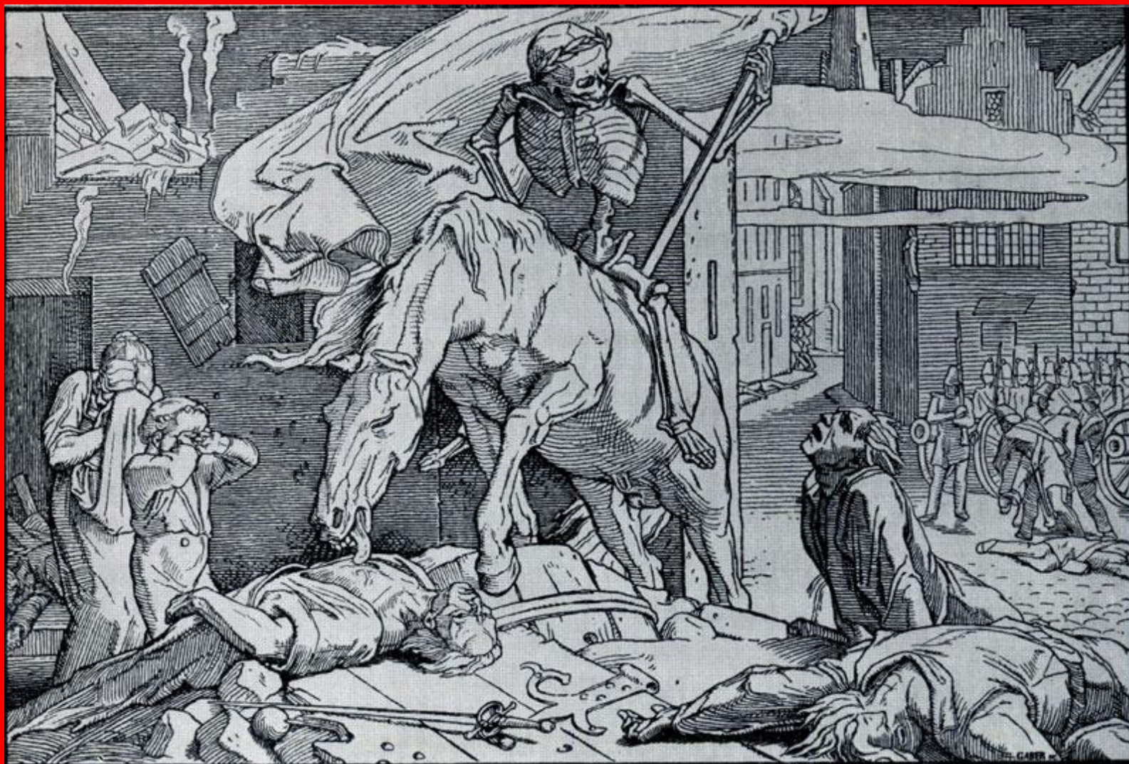
Бенжамен Вотье. Смерть победитель.