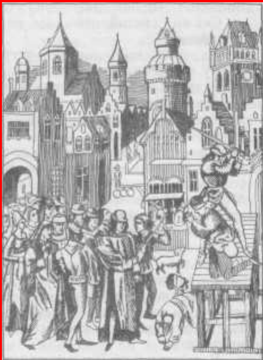
Убийство Уота Тайлера

Уот Тайлер был схвачен и убит, а повстанцы вытеснены из Лондона, НО правительству пришлось снижать налоги.