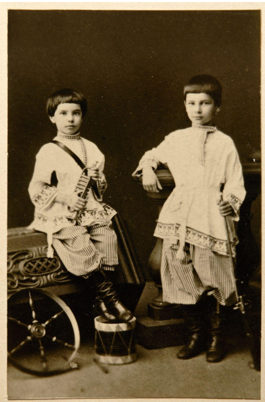
Петр Столыпин семи лет с братом в 1869 г.