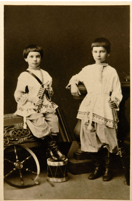
Петр Столыпин семи лет с братом в 1869 г.