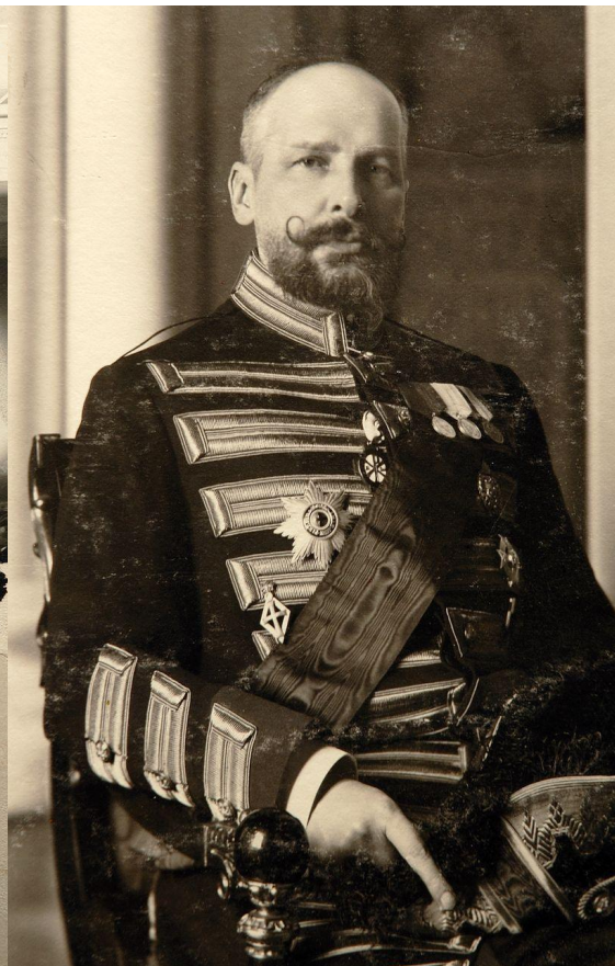
П.А.Столыпин в Зимнем дворце в 1908 г.