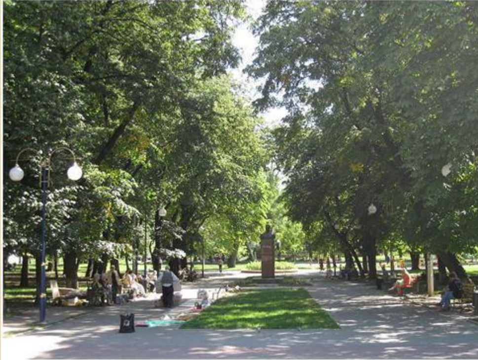
Парк ім. І. Франка зараз