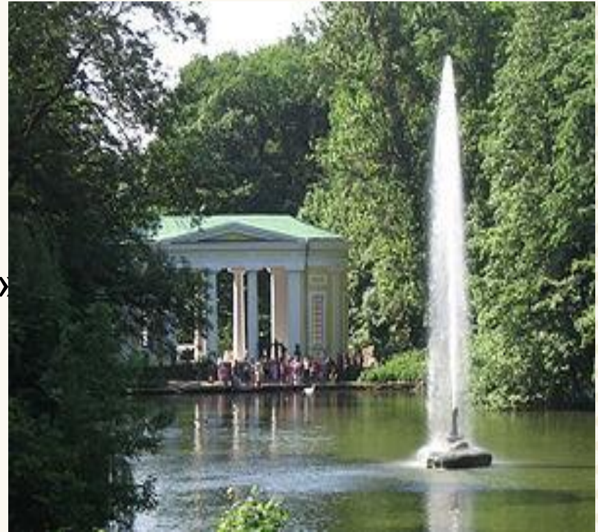
Софіївський парк в Умані