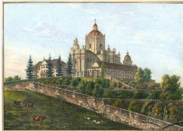
Митрополичі сади (Львів)