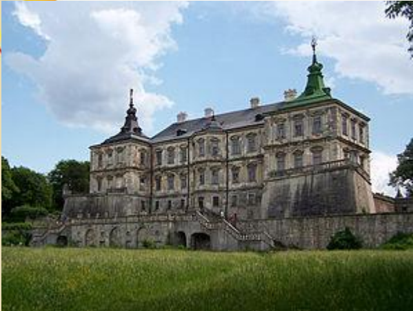
Італійський парк (Підгірці)