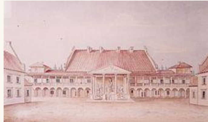
Замковий сад (Жовква)