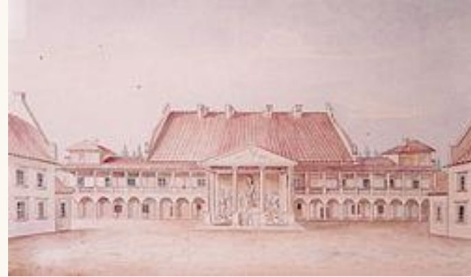
Замковий сад (Жовква)