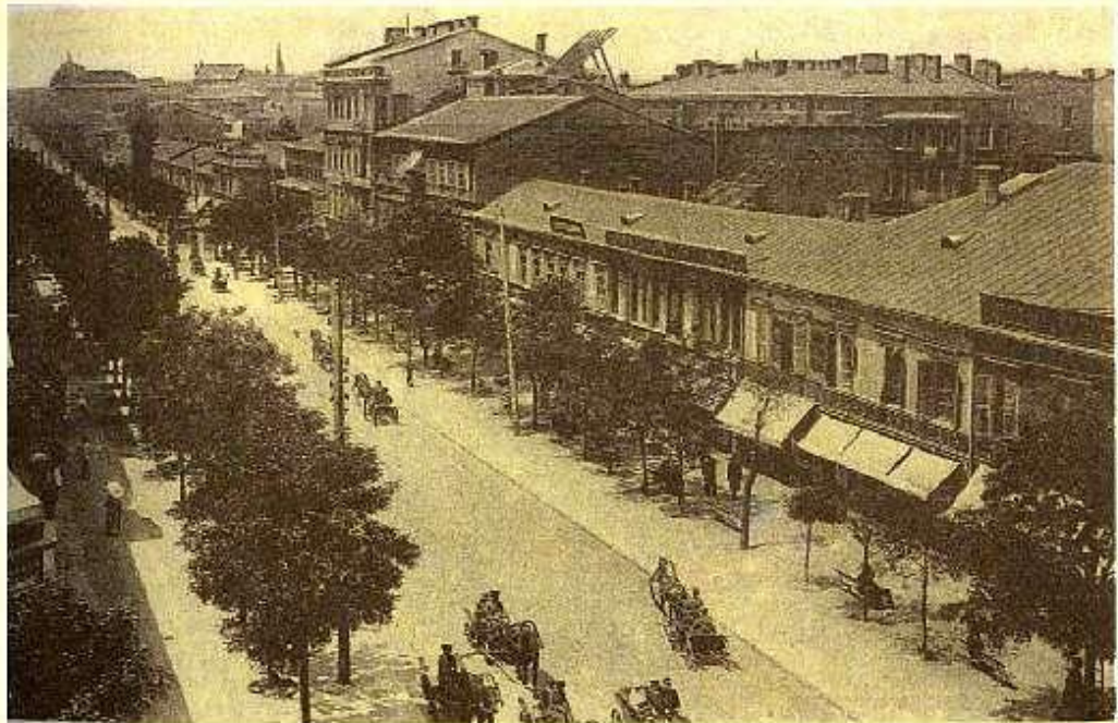
Общій видъ Дерибасовской ул. — Vue générale de la rue de Ribas.