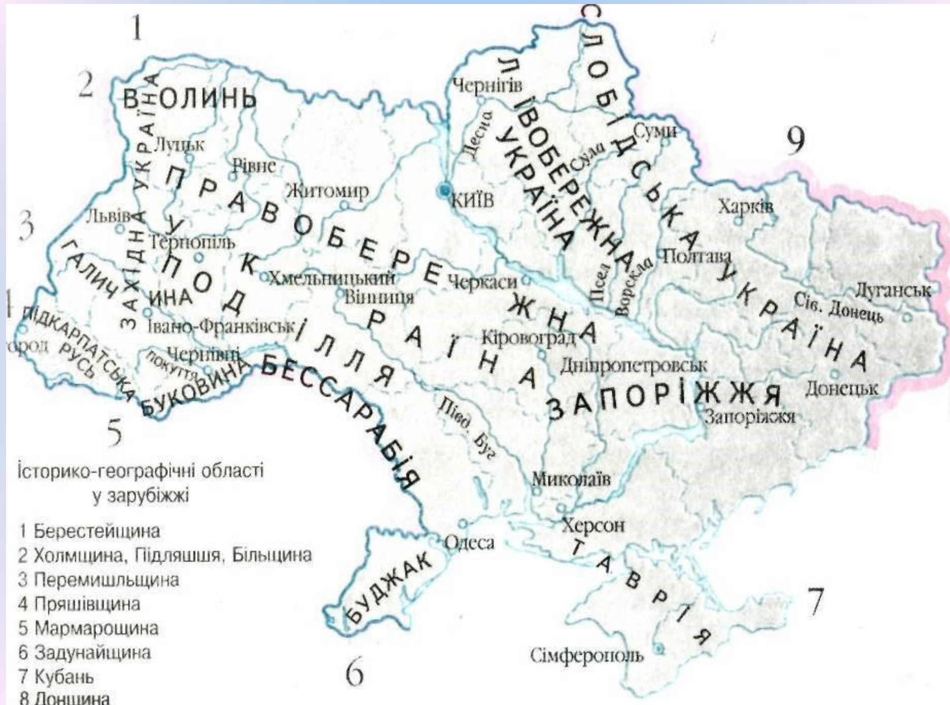
Історико-географічні області у зарубіжжі