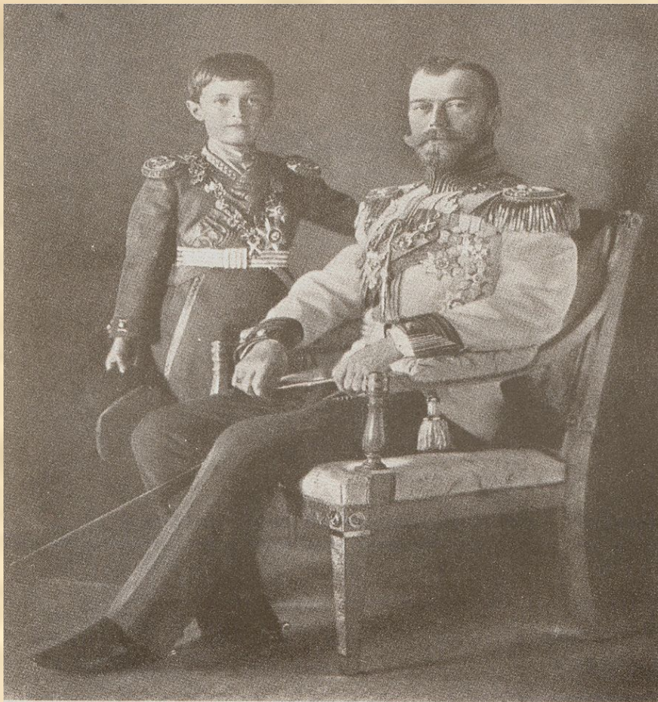
Его Императорское Величество Государь Императоръ НИКОЛАЙ АЛЕКСАНДРОВИЧЪ съ Наслѣдникомъ Цесаревичемъ и Великимъ Княземъ АЛЕКСѢЕМЪ НИКОЛАЕВИЧЕМЪ.

Вопрос о проведении железной дороги на Мурман поднимался неоднократно, но не сдвинулся с места пока не грянула первая мировая война. Дорога к незамерзающему Баренцеву морю стала совершенно необходима.