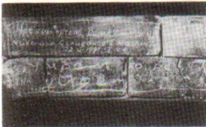
Надписи на кирпичах Брестской крепости

Письма, иногда последние письма, настенные записки героев гестаповских тюрем, письма – завещания тех, кто выбрал смерть ради жизни других, помогут нам услышать голоса известных и неизвестных героев, мужественных солдат и хрупких девушек, закаленных бойцов и никогда ранее не державших в руках оружие людей.