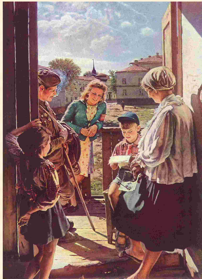
А.Лактионов. Письмо с фронта