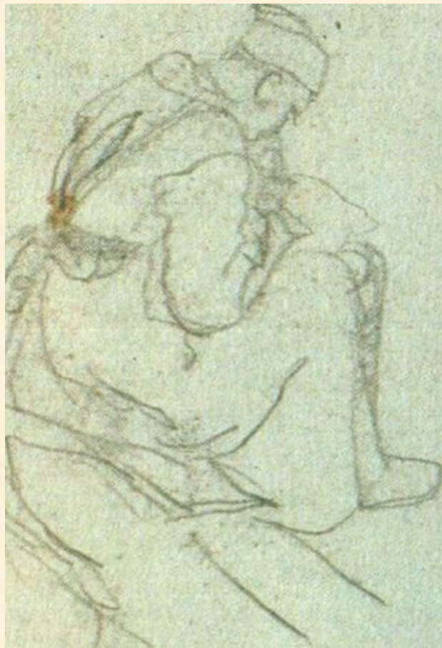
В.В Зимин. Письмо домой