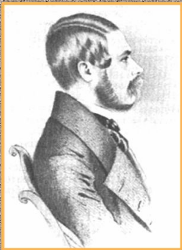
Николай Соломонович Мартынов