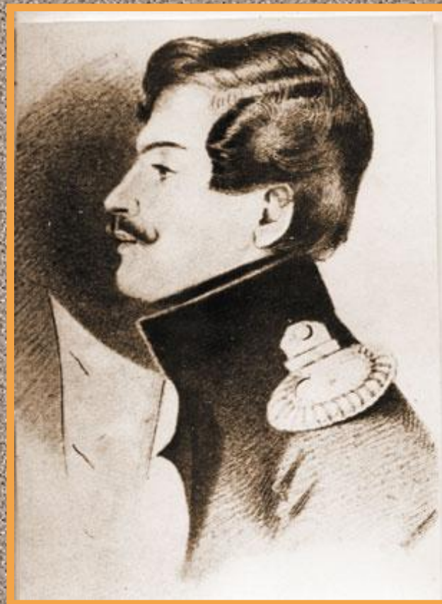
Жорж Шарль Геккерн- Дантес