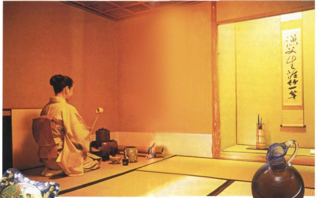
Интерьер чайного домика

Перш ніж приступити до чайної церемонії, усі учасники, концентруються на своїх відчуттях, думках та почуттях, щоб набути необхідного психологічного настрою. Тільки так можна відчути усю духовність чайної церемонії і відчути "смак дзэн", що означає - "смак чаю".