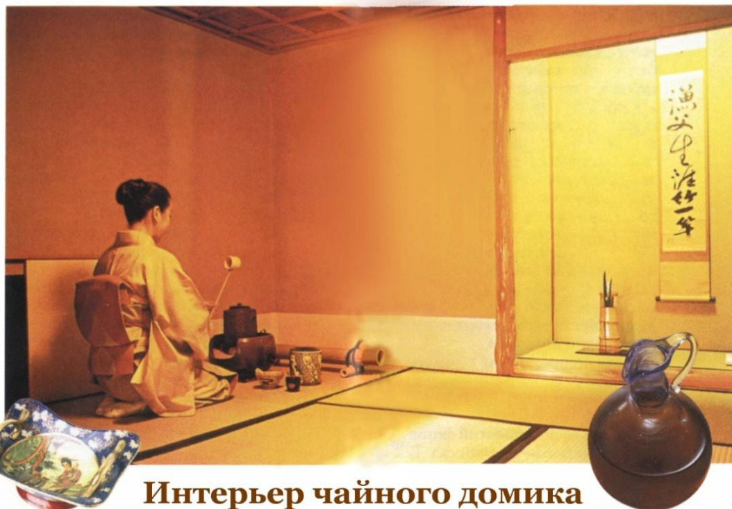
Интерьер чайного домика

Перш ніж приступити до чайної церемонії, усі учасники, концентруються на своїх відчуттях, думках та почуттях, щоб набутися необхідного психологічного настрою. Тільки так можна відчути усю духовність чайної церемонії і відчути "смак дзэн", що означає - "смак чаю".