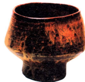
Чашки для чайной церемонии. Начало XVII в.