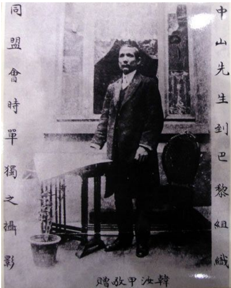
Сунь Ятсен в Париже, 1905г.