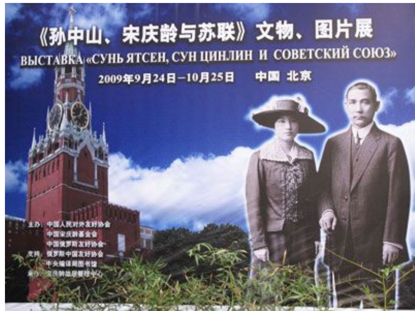
Выставка «Сунь Ятсен, Сун Цинлин и Советский Союз»

Выделяется уездное самоуправление , через которое осуществляется прямое народовластие . Только прямая власть народа является подлинным народовластием