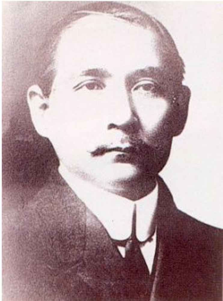
Сунь Ятсен в 1912 году, после отставки