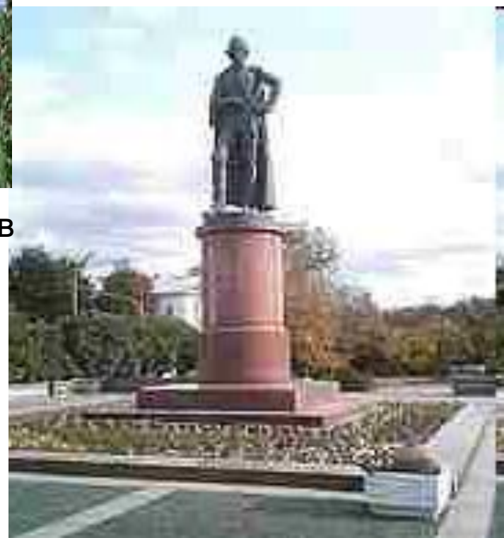
Памятник Суворову в Москве. Скульптор О. К. Комов