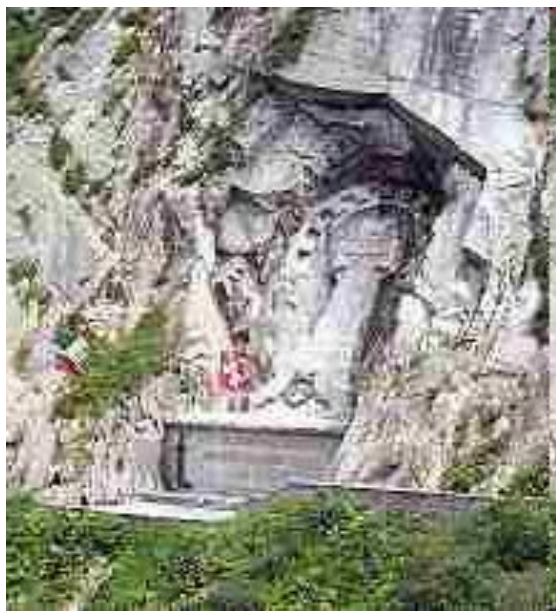
Памятник Суворову в швейцарских Альпах