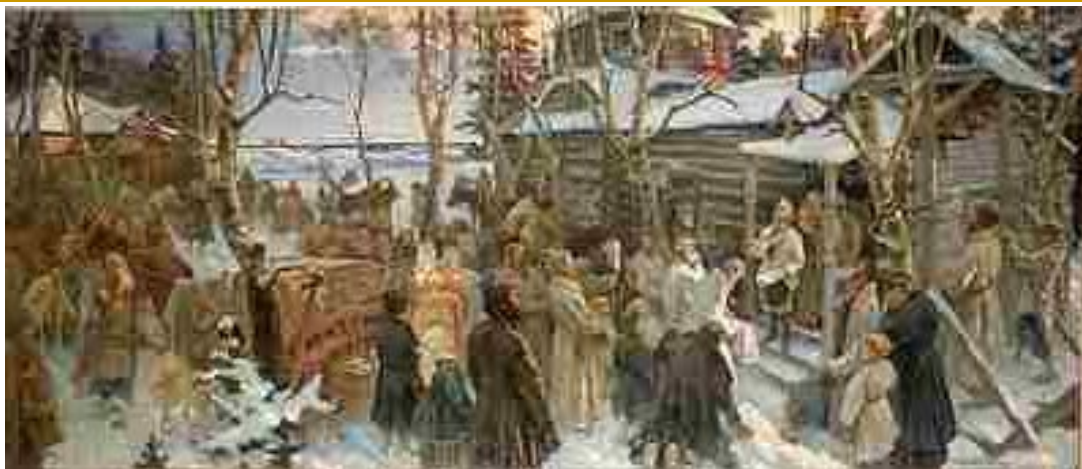
Итальянский поход 1799 года