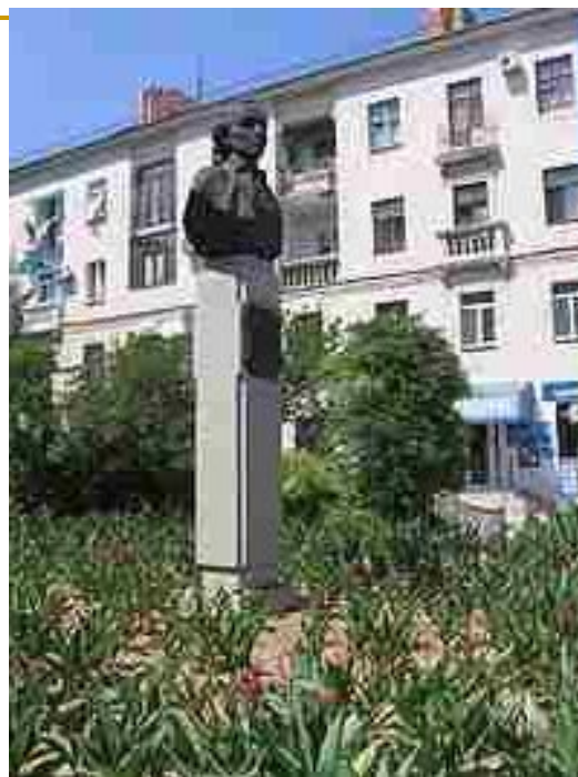
Памятник А. В. Суворову в Севастополе, 1983