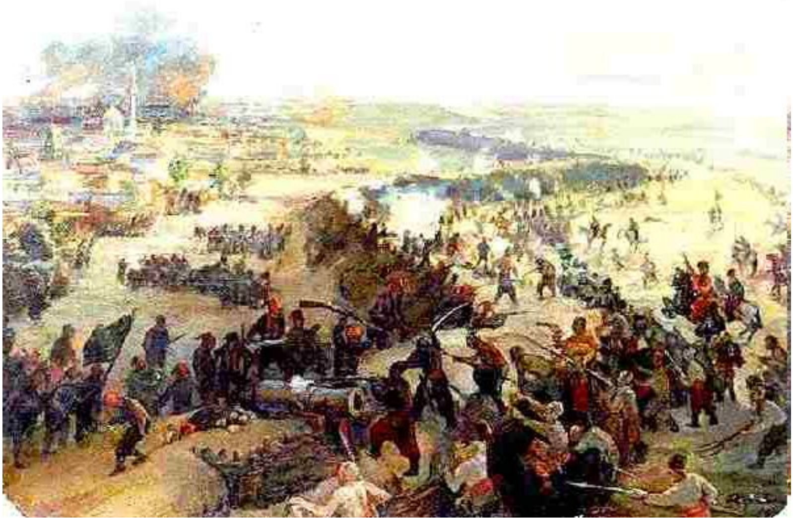
Русско-турецкая война 1787—1791