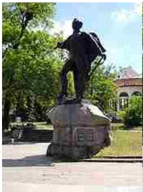
Памятник Суворову на месте редута на берегу Салгира