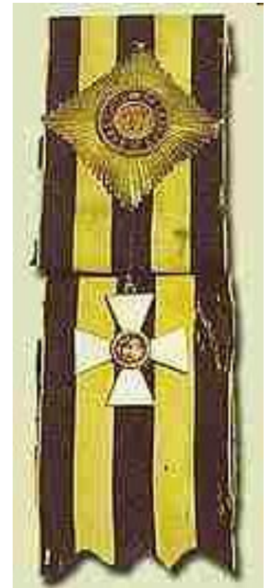
Орден Св. Георгия 1-й степени. Вышитая звезда и лента принадлежали А. В. Суворову