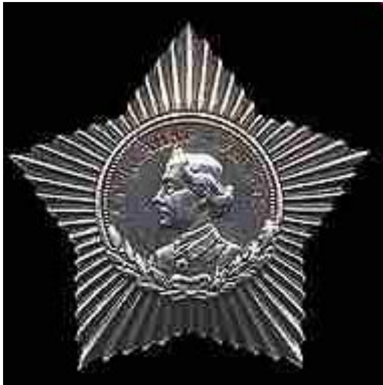
Орден Суворова III степени