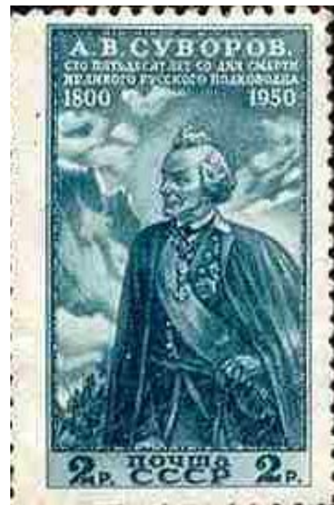
Марка «Суворов в Альпах» (с рисунка Николая Аввакумова, 1941, Москва, Государственный музей изобразительных искусств имени А. С. Пушкина)