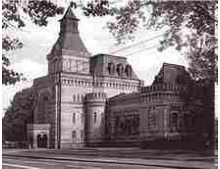
Мемориальный музей Суворова в Санкт-Петербурге