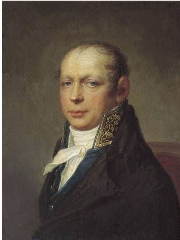
Андреян Дмитриевич Захаров