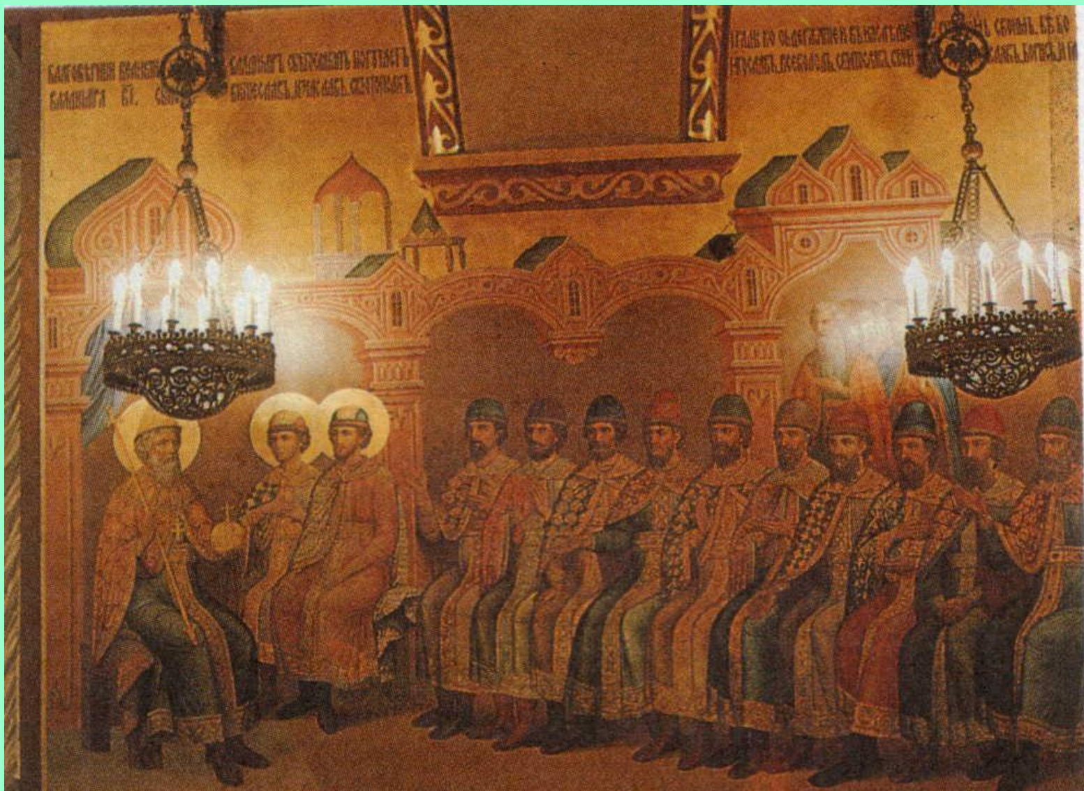
князь Всеволод «Большое Гнездо» с сыновьями