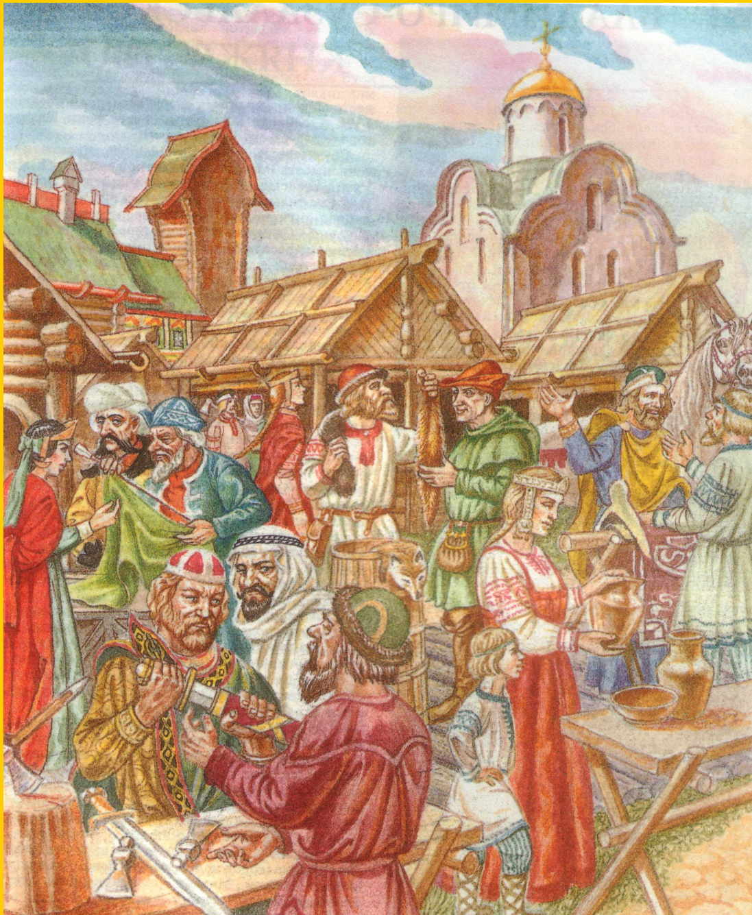
Торг в Новгороде