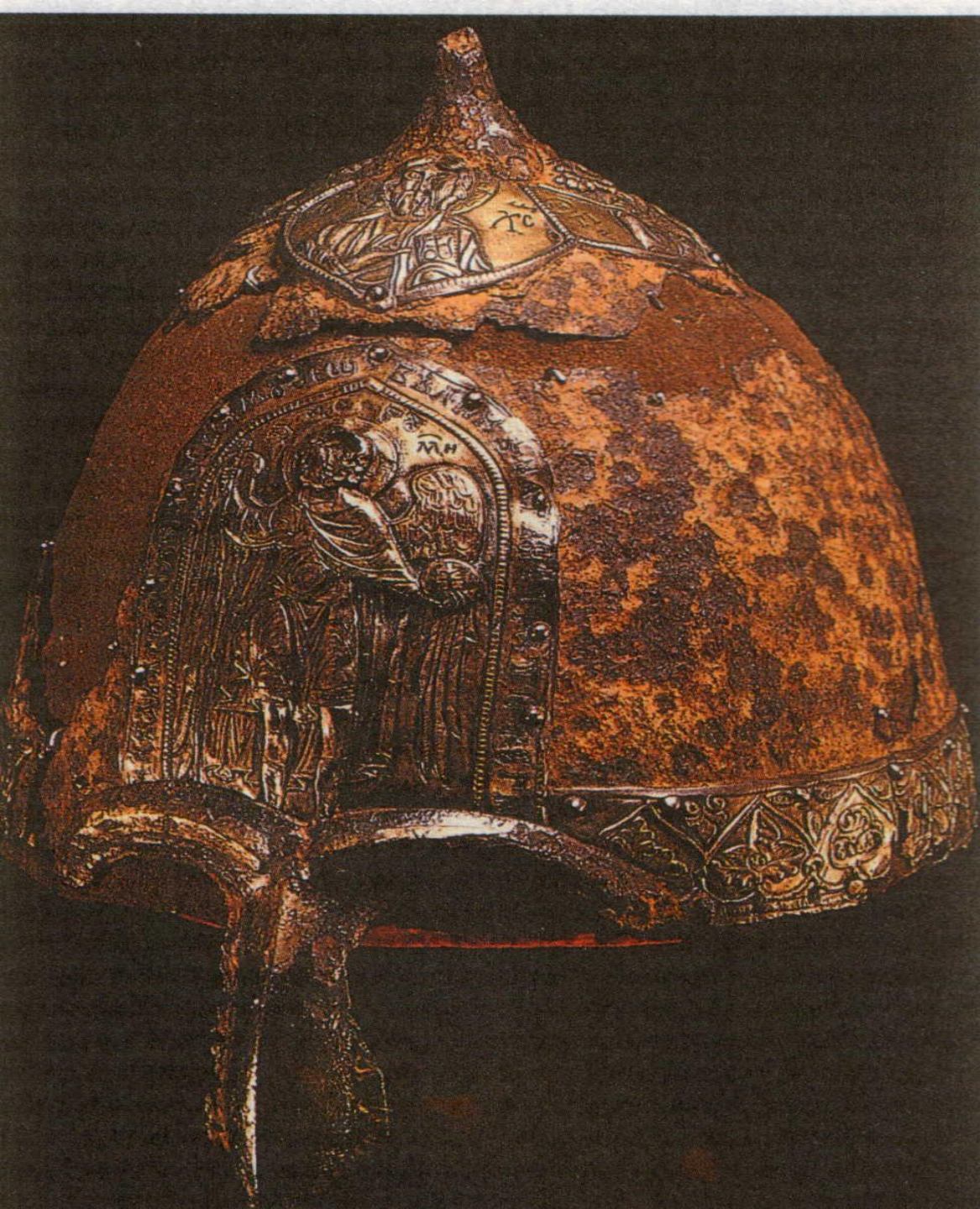
Шлем Ярослава Всеволодовича, отца Александра Невского