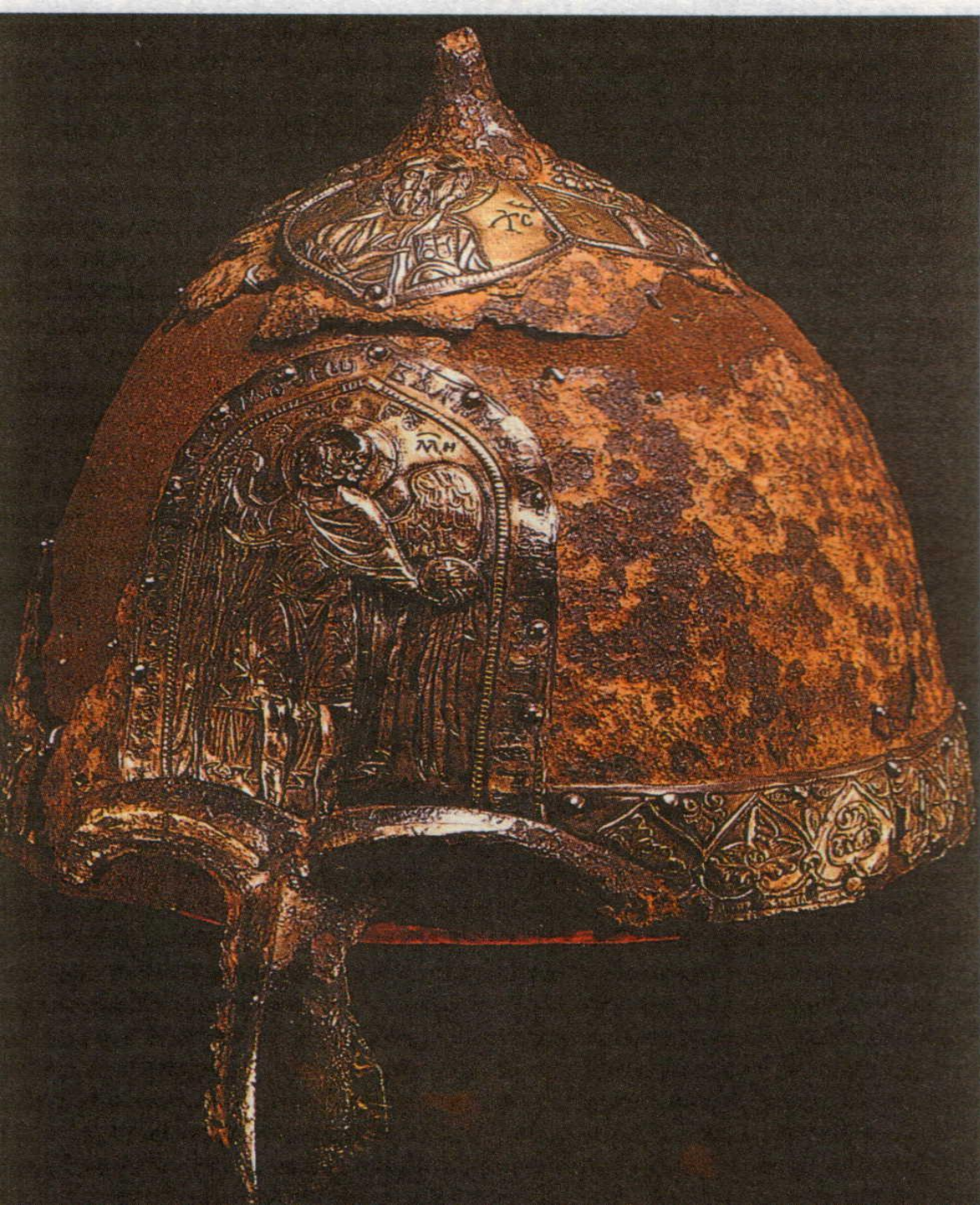
Шлем Ярослава Всеволодовича, отца Александра Невского