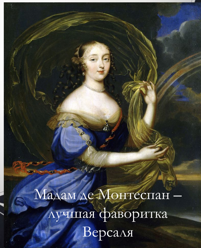
Мадам де Монтеспан — лучшая фаворитка Версаля