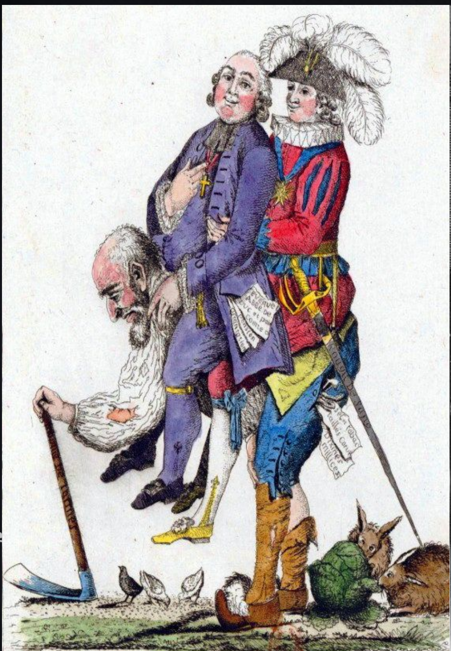
A FAUT ESPERER Q'EU JEU LA FINIRA BENTOT