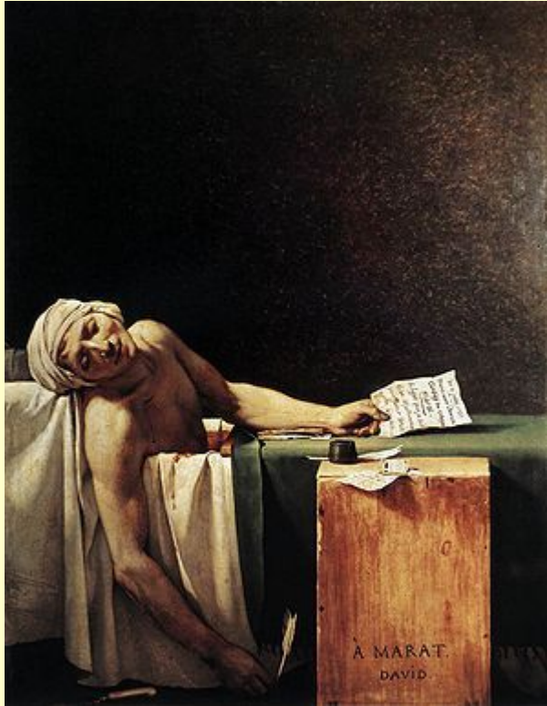
Жак Луи Давид. Смерть Марата, 1793

Задание: по фактам биографии определить личность, о которой идет речь.