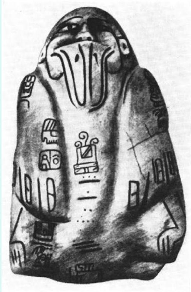
96. Нефритовая статуэтка из Сан-Андерес-Тустла, Мексика