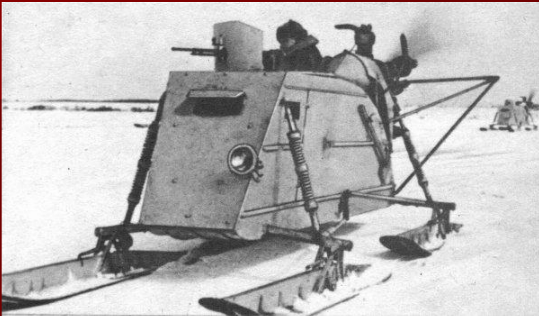
Аэросани времен ВОВ