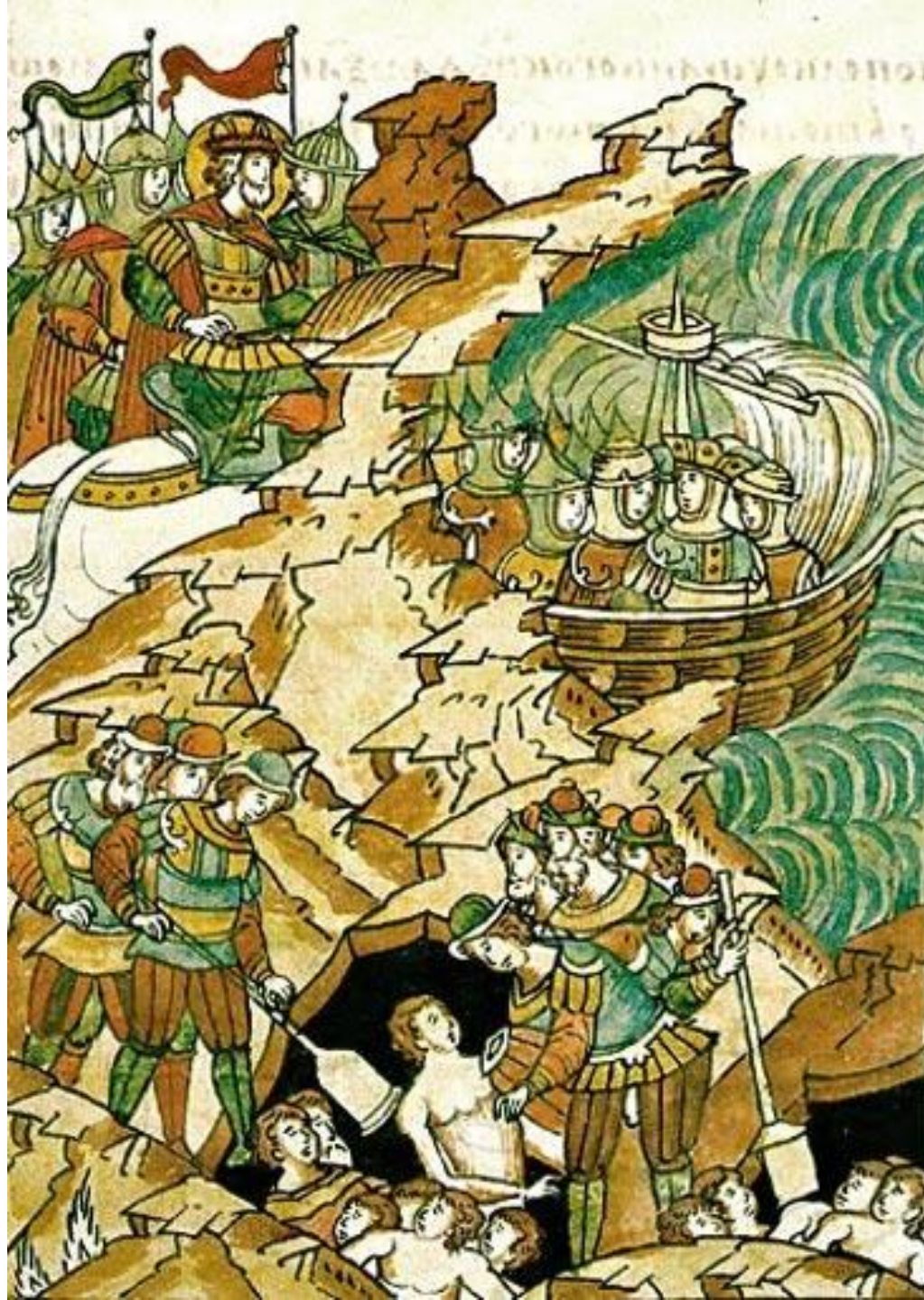
Невская битва. Миниатюра из Лицевого Жития Александра Невского