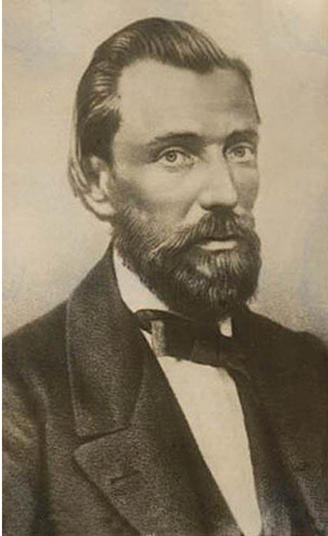
Иван Саввич Никитин (1824–1861). Фото XIX в.

Под большим шатром Голубых небес Вижу даль степей Зеленеется;