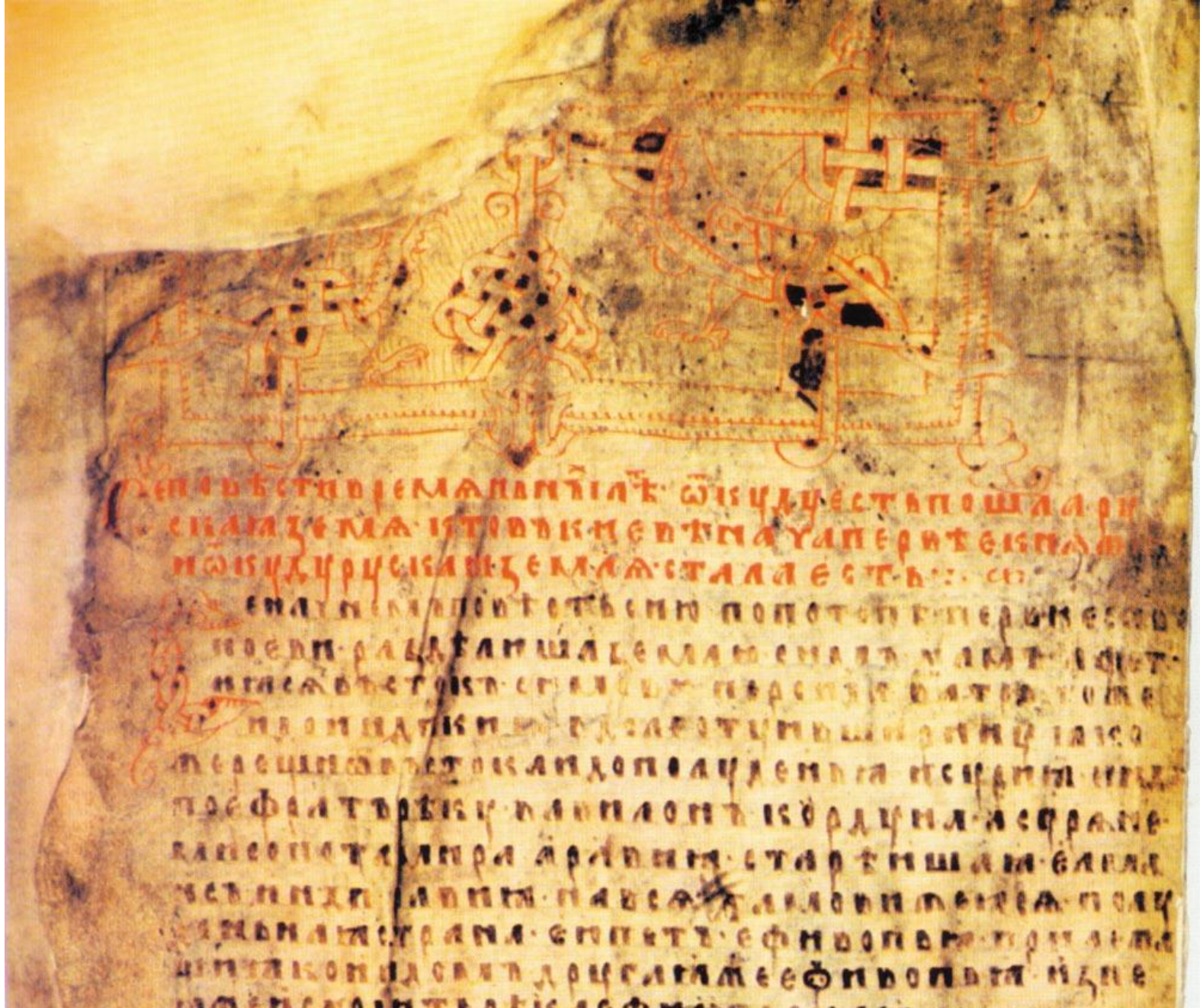
«Повесть временных лет» Нестора Летописца. Первый лист