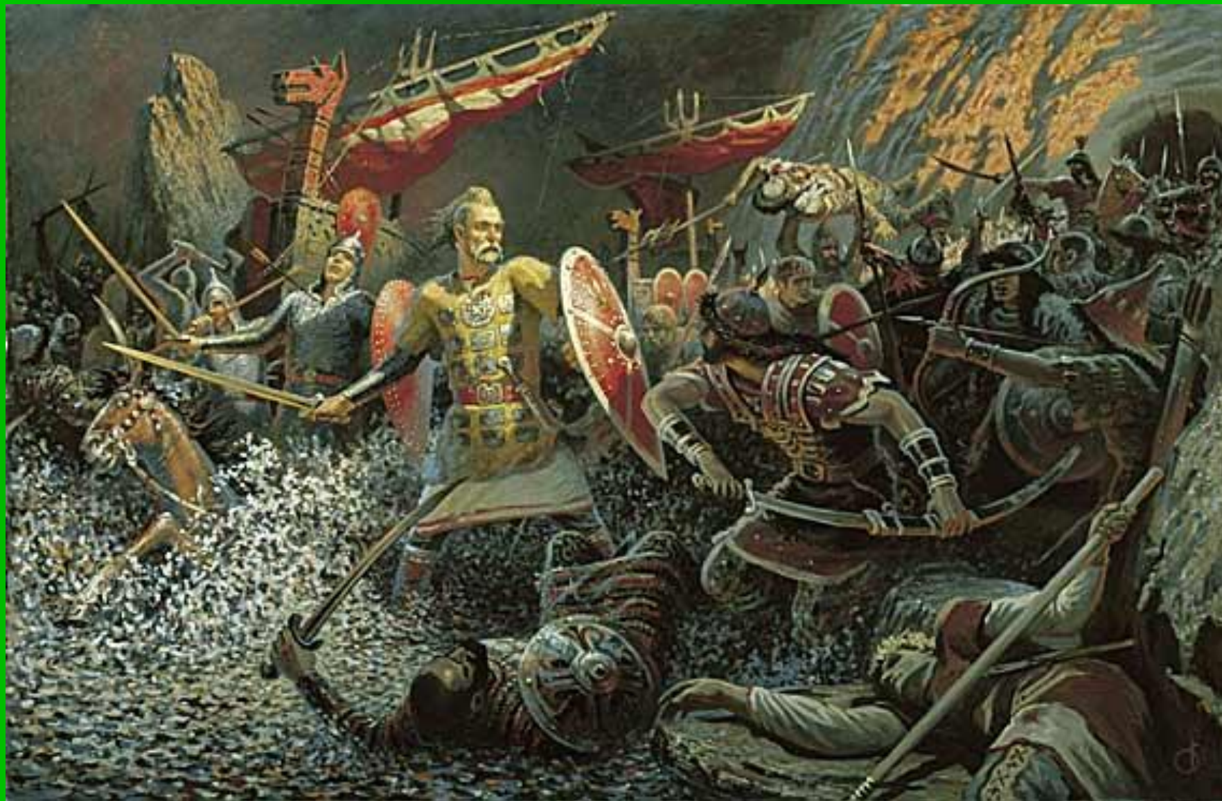
Бой с печенегами