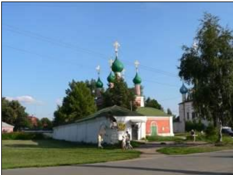
На Соборной площади Переславля-Залесского стоит церковь Александра Невского.

Александр Ярославич Невский родился 30 мая 1219 года в городе Переславле в княжьих теремах рядом со Спасо- Преображенским собором и прожил на свете сорок четыре года и пять с половиной месяцев.