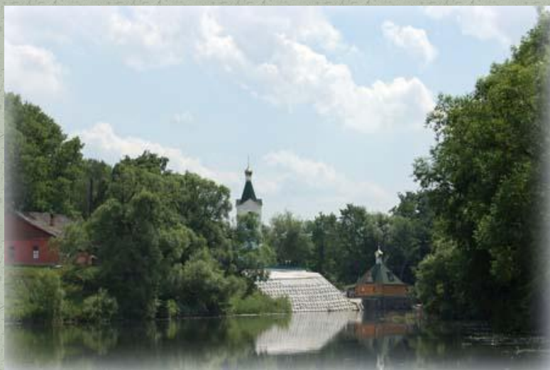
Территория Трегуляевского монастыря во имя Крестителя Господня Иоанна.