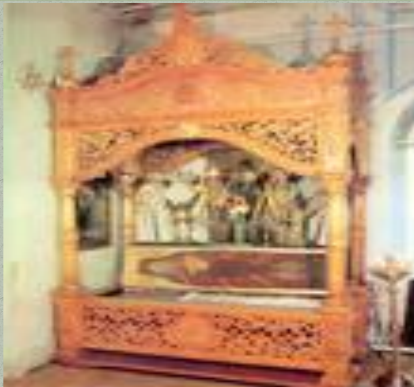
Рака с мощами святителя Питирима.

«Духовная моя братия и спостницы! Не забудьте меня, егда молитися, но видевше мой гроб, поми- ните мою любовь и молитесь Христу, да учинит дух мой с правед- ными».