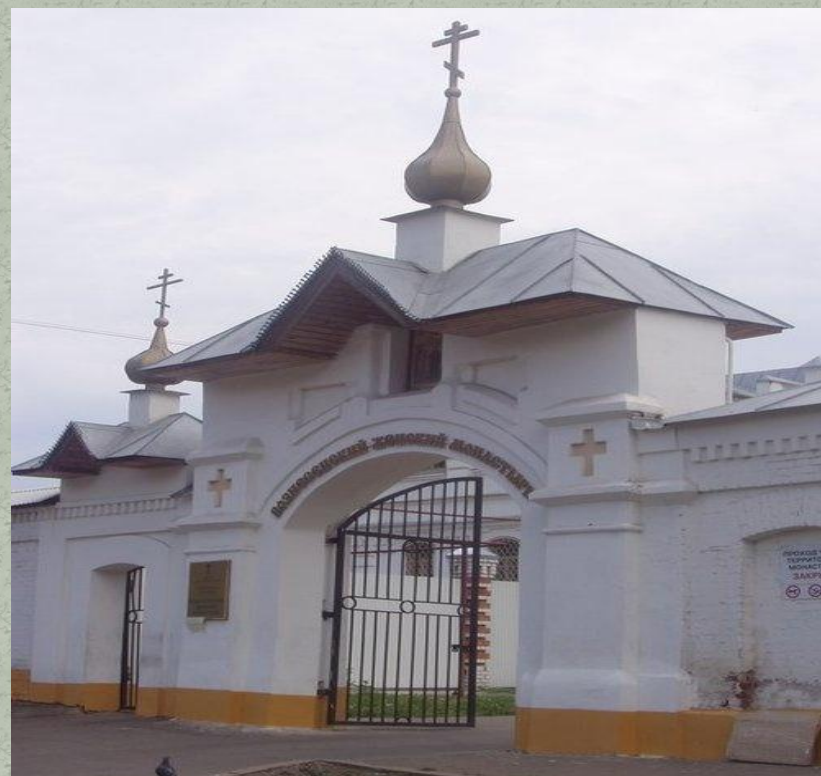
Вознесенский женский монастырь .