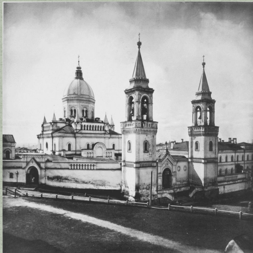
Иоанно-Предтеченский монастырь (основанный