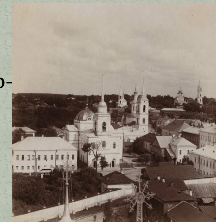
Г. Вязьма, Смоленской губернии.

благочестивые христиане, привившие любовь к Богу и Святой церкви своим детям.