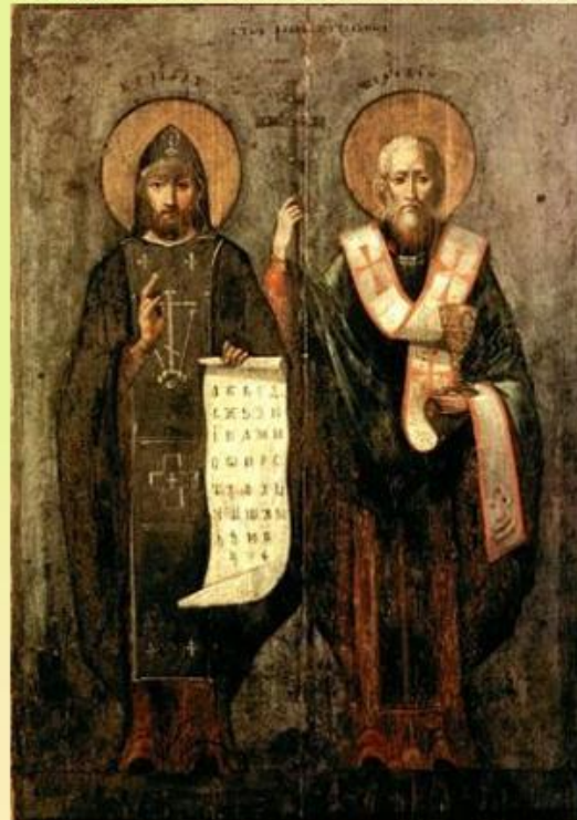
Кирилл и Мефодий – создатели славянской азбуки