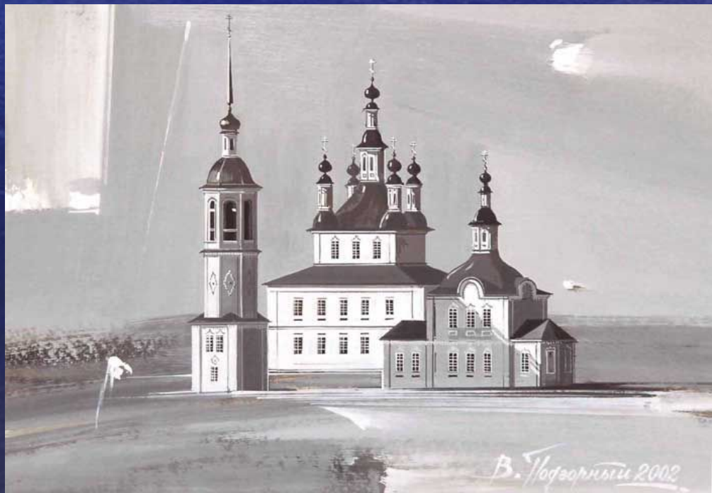
Церкви Спасо-Преображенская и Троицкая на Тиксне.