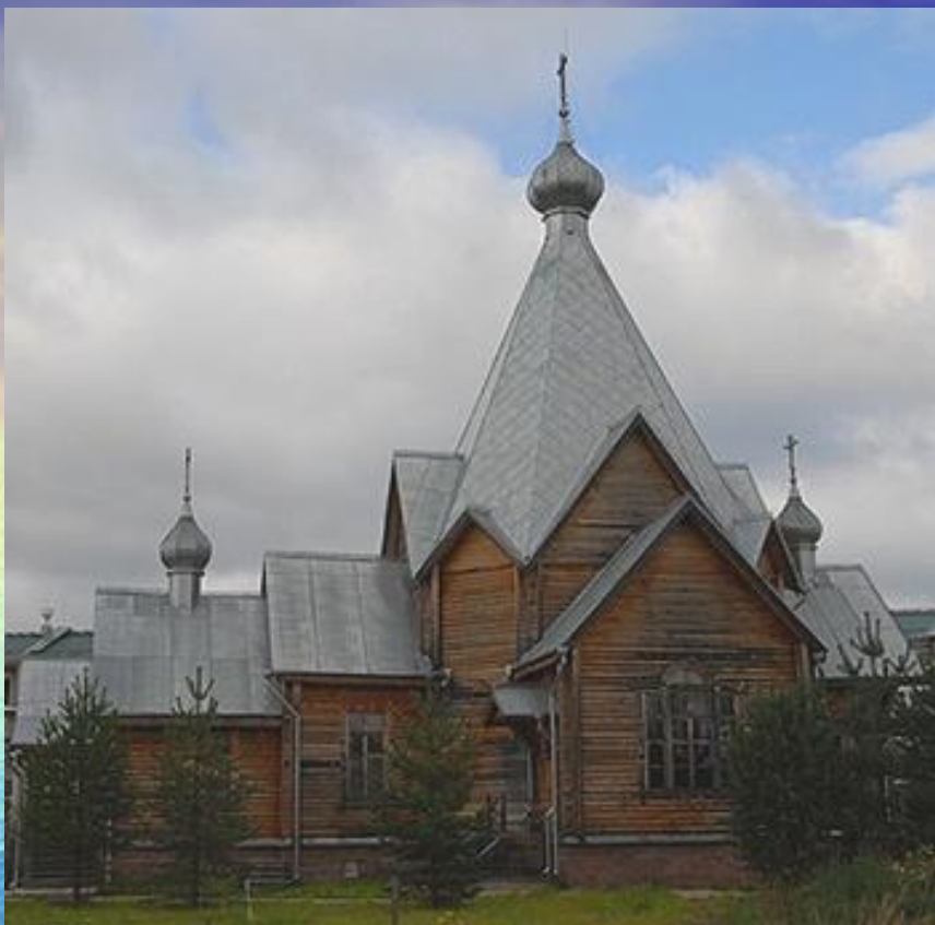
Церковь Вассиана Тиксненского в п. Юбилейный Вологодской области.