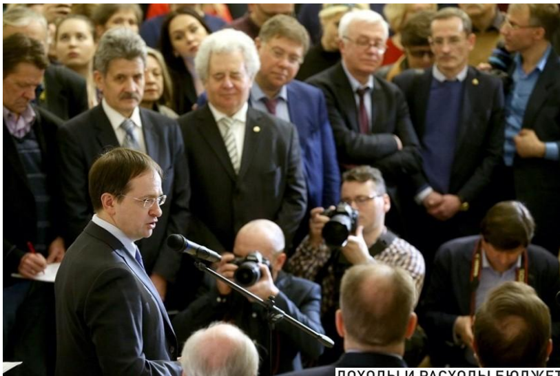
Министр культуры РФ В.Р. Мединский на открытии выставки «1917. Код революции»

ДОХОДЫ И РАСХОДЫ БЮДЖЕТА НА 2017 ГОД, МЛРД РУБ.