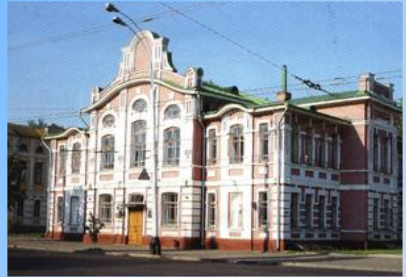
Институт им. С.В. Вокховича