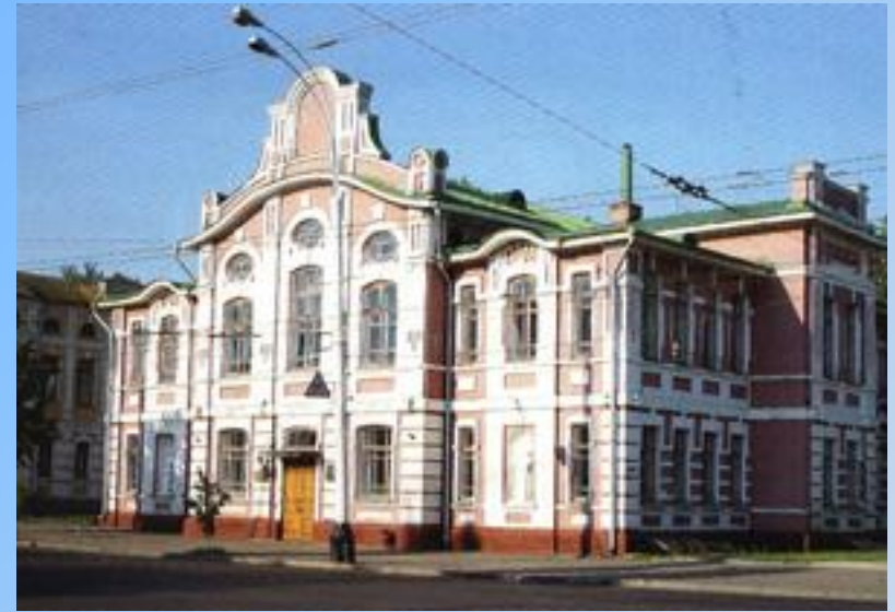
Институт им. С.В. Дзюмшинова