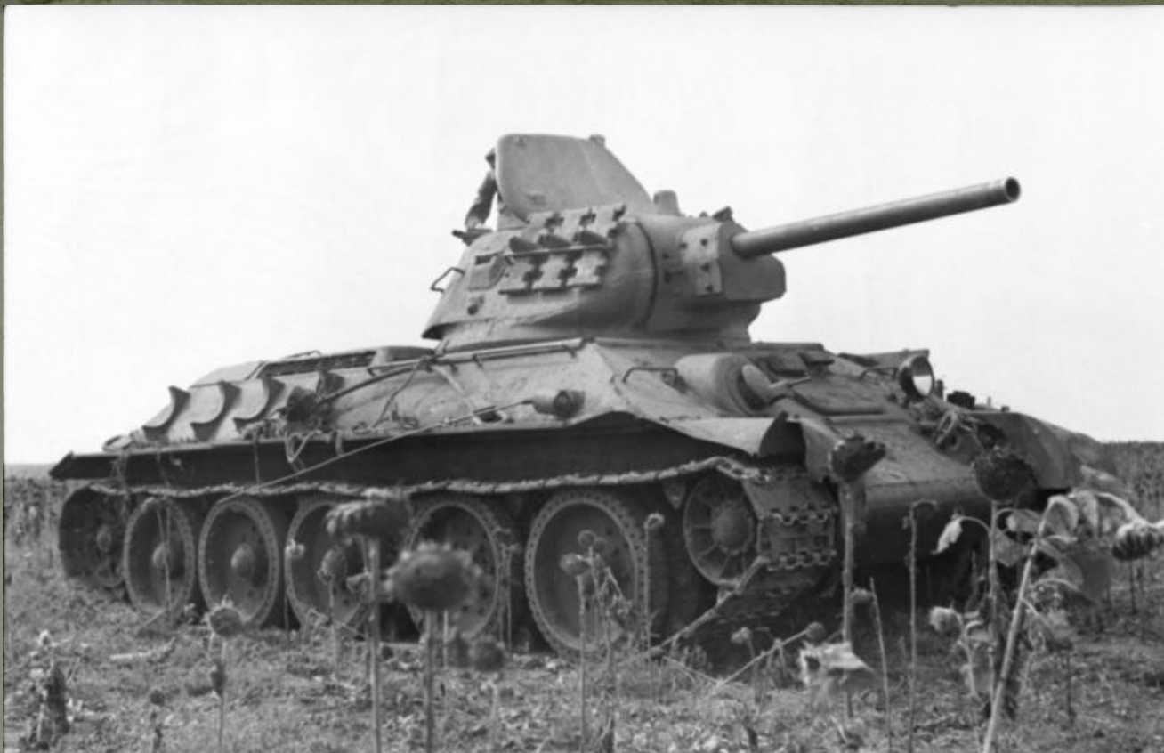
1943 August - September