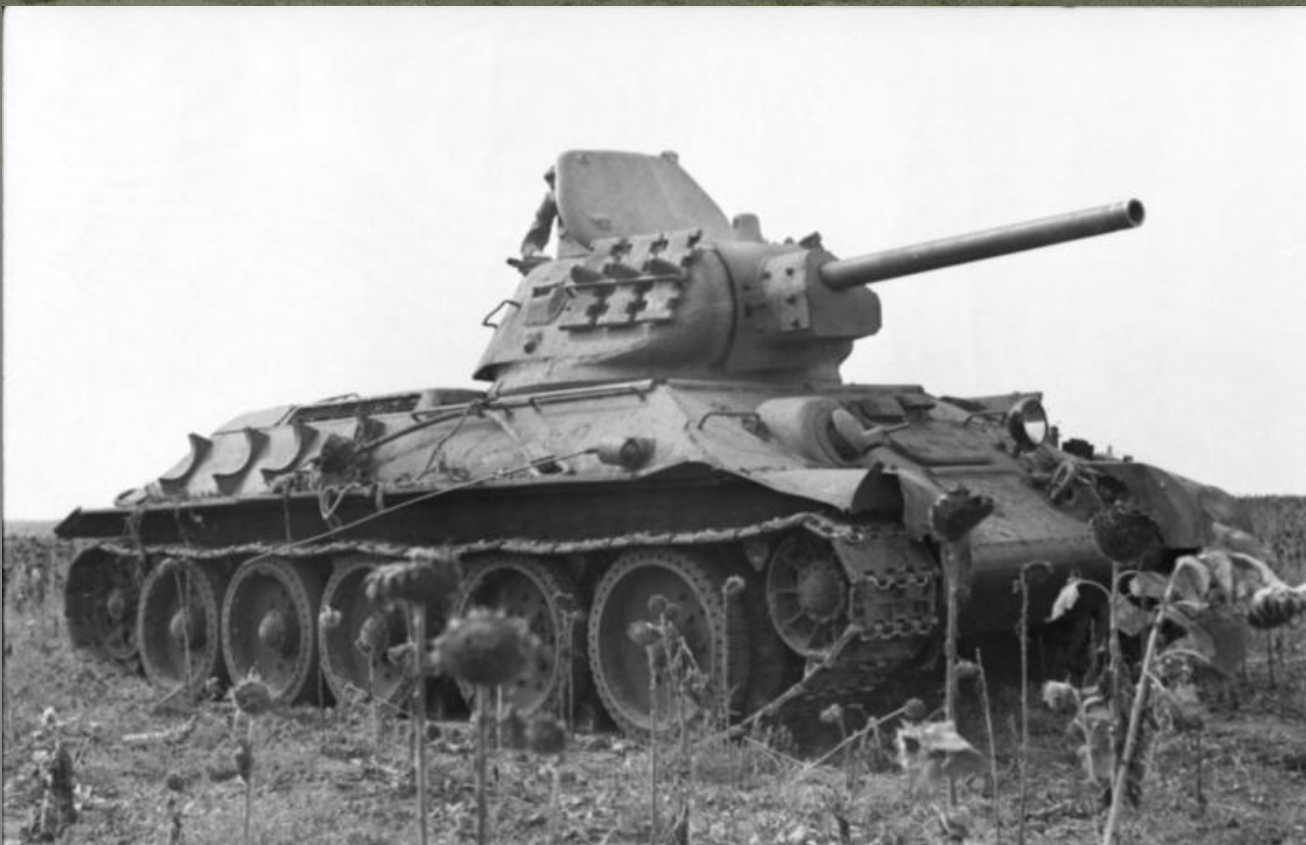
1943 August - September