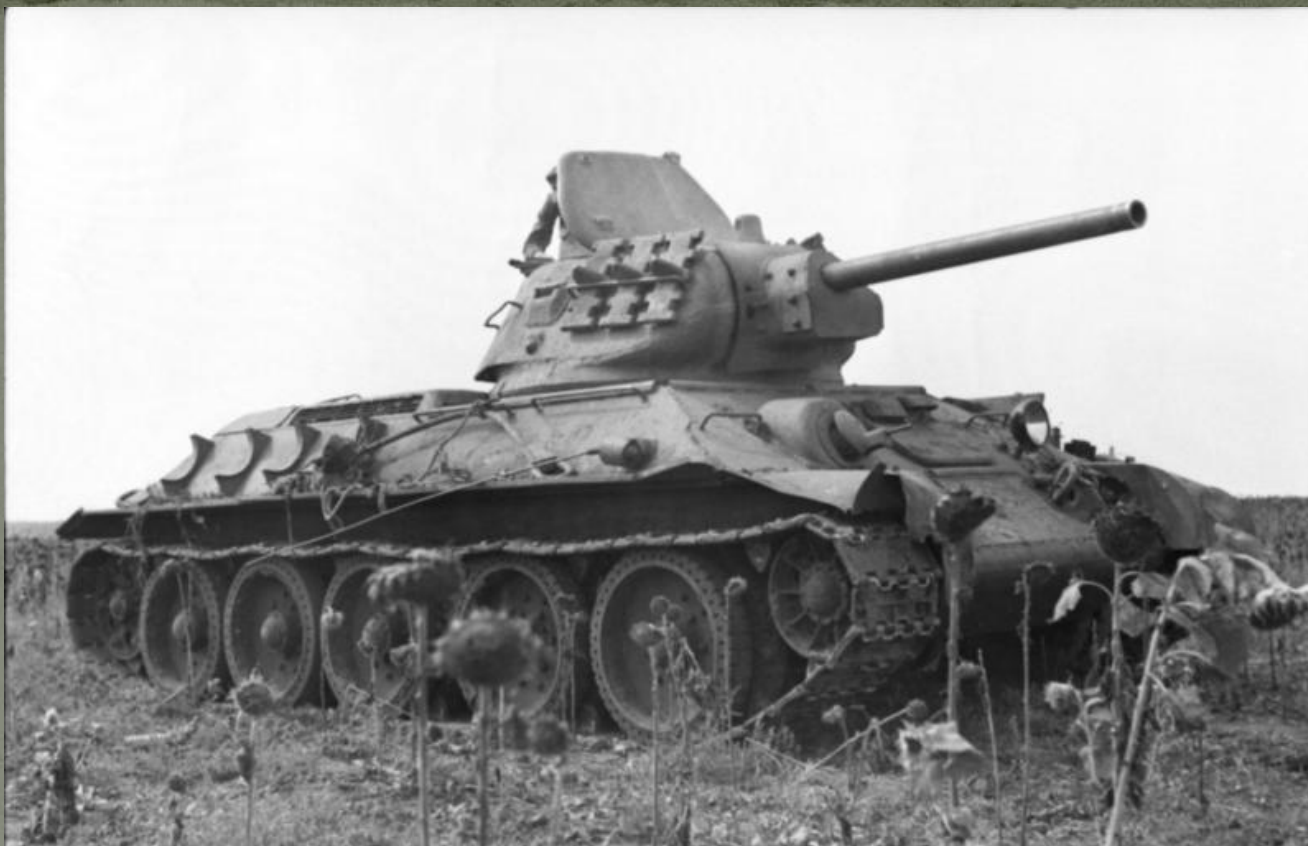
1943 August - September