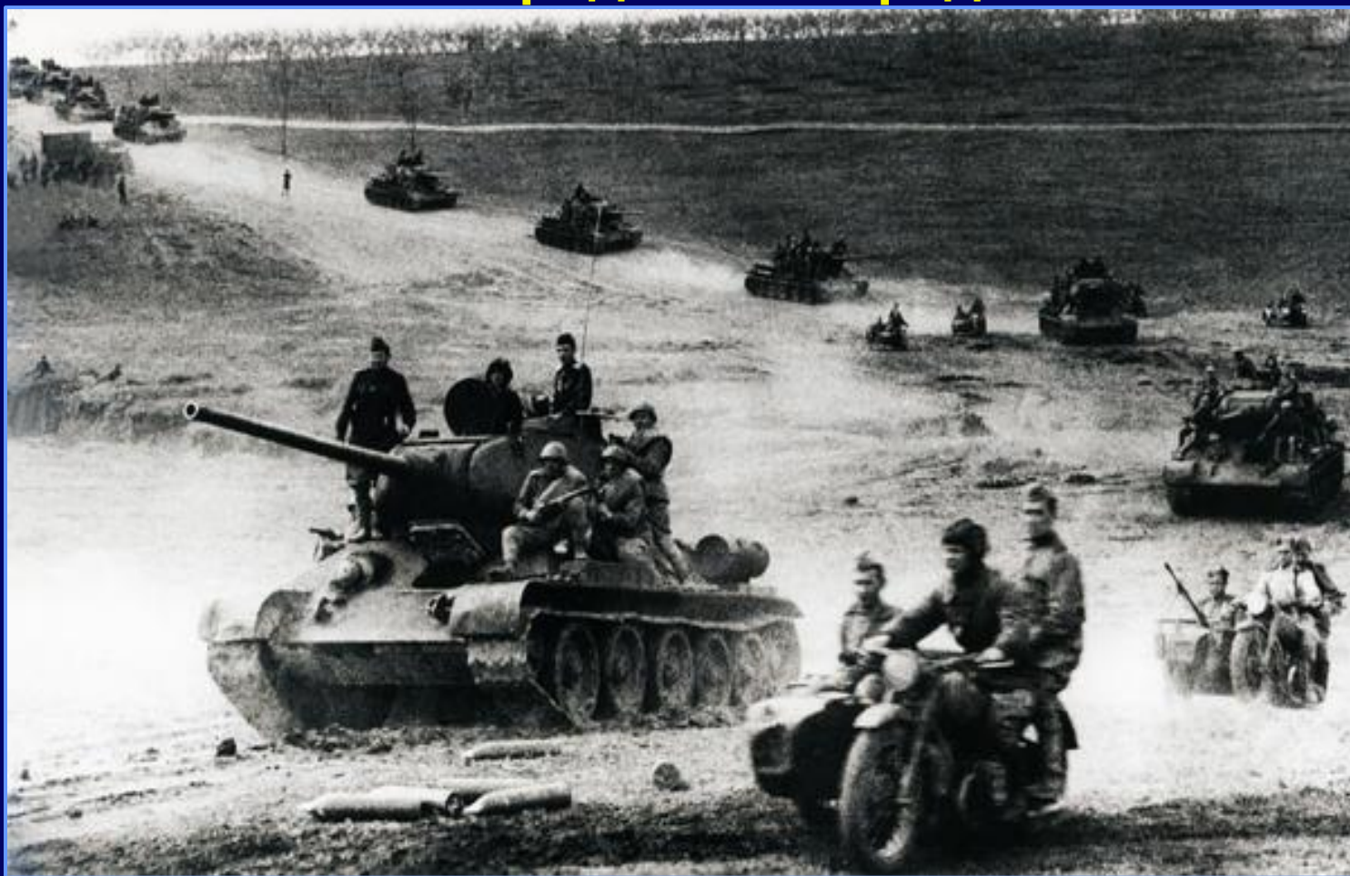
Танковая атака. 1942 г. Сталинград