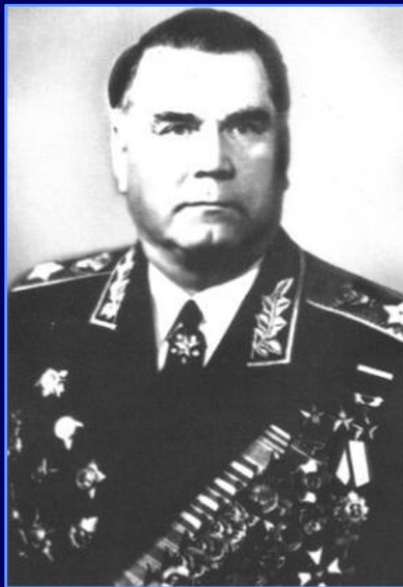
Иван Игнатьевич Якубовский