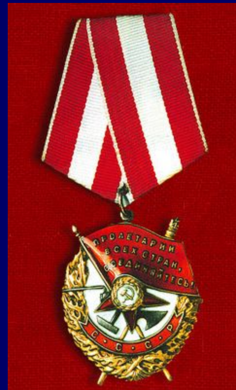
Орден Красного знамени