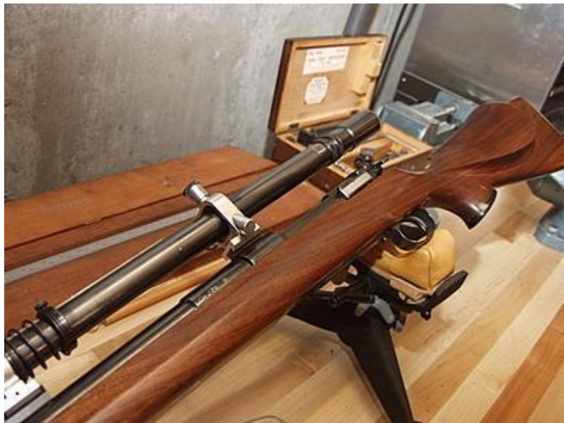
Ружейная болванка для винтовок и автоматов