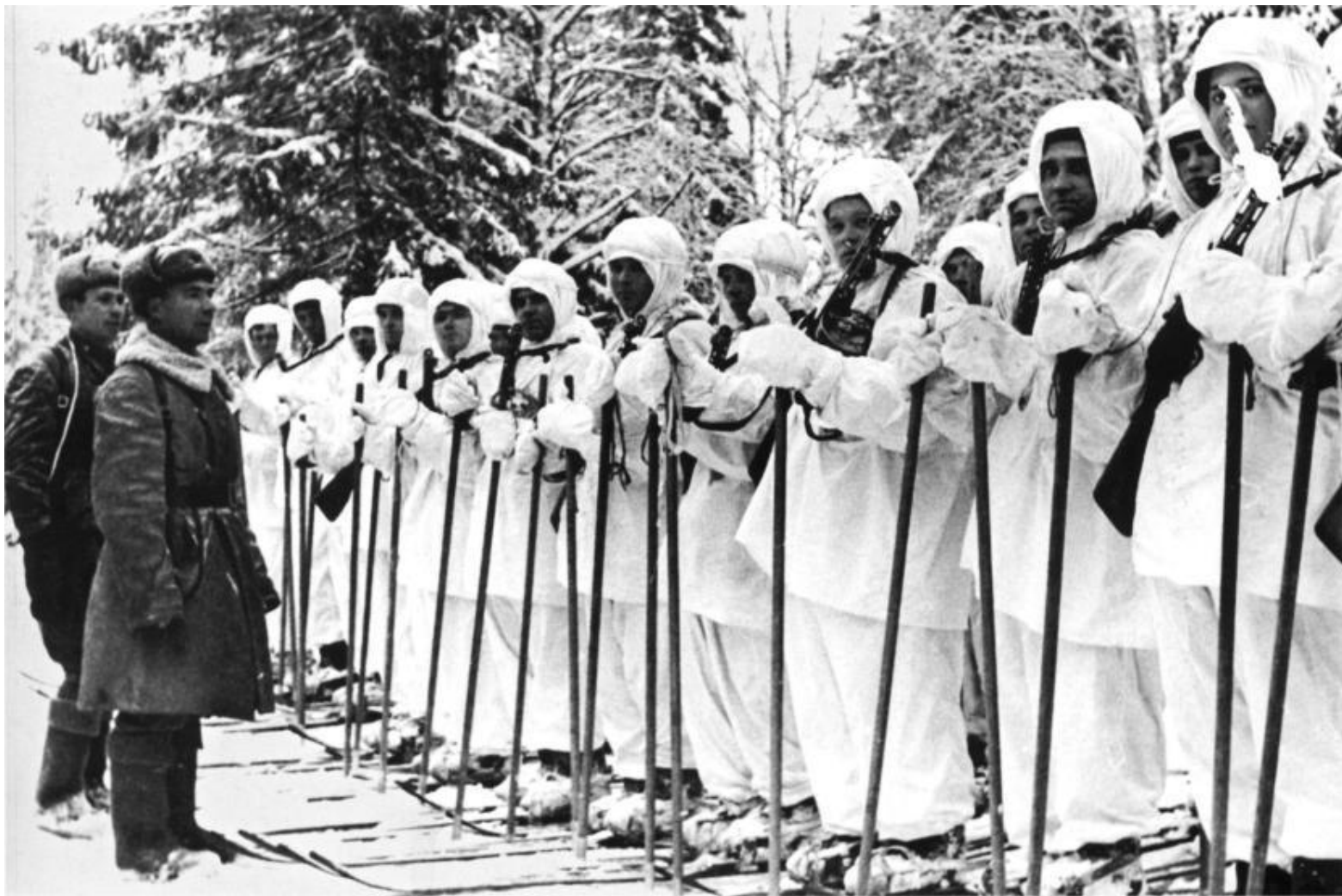
Рота воинов - лыжников слушает напутствие командира перед боем