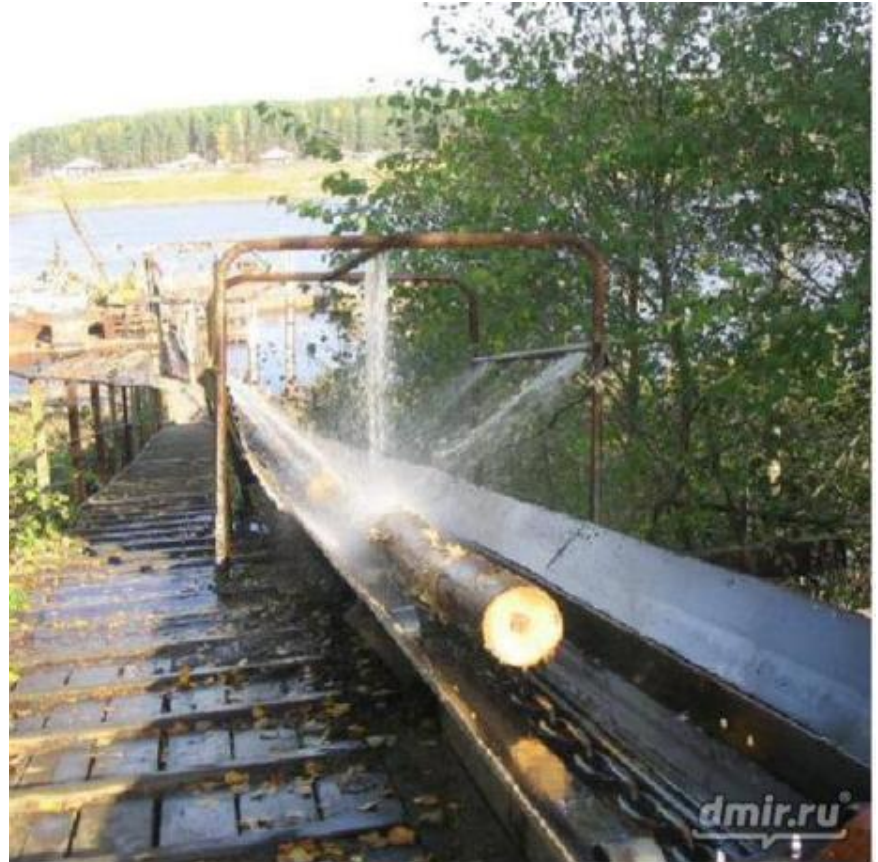
Бревно на лесотаске