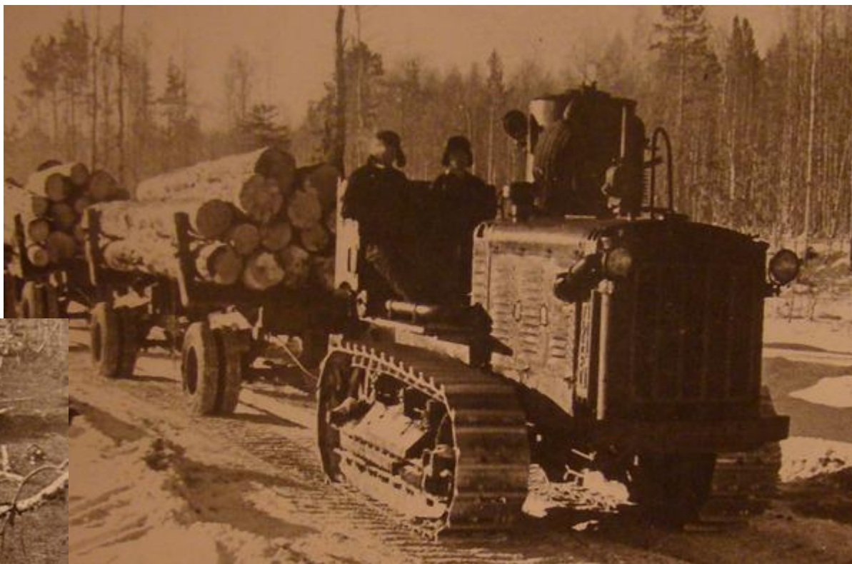
тракторная ледяная дорога