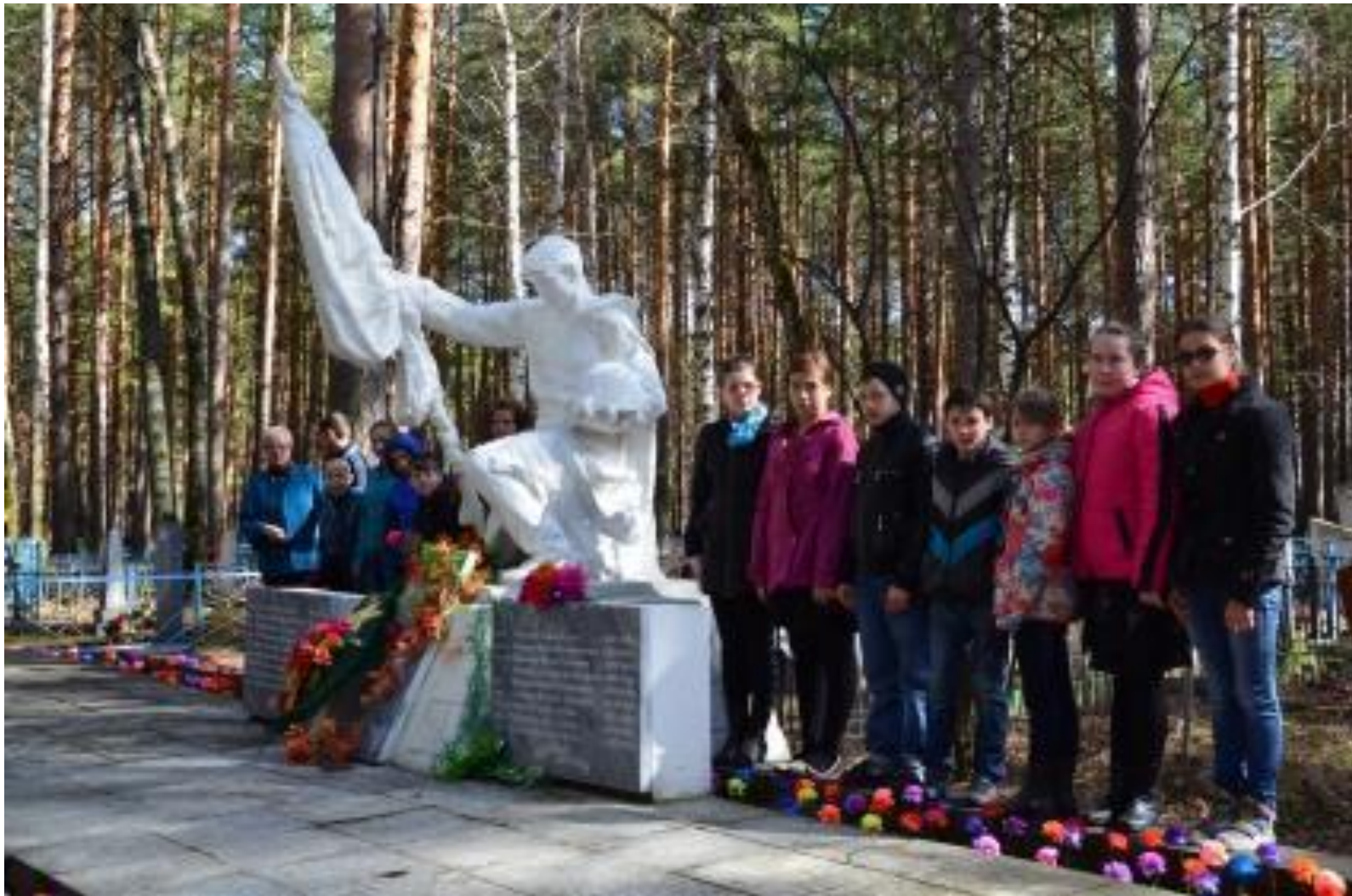
Памятник на могиле воинов, умерших от ран в тавдинских госпиталях. Городское кладбище (пос. Еловка). Установлен в 1961 г.