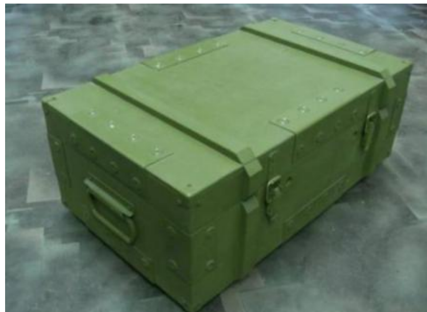
Ящики - тара для снарядов и патронов