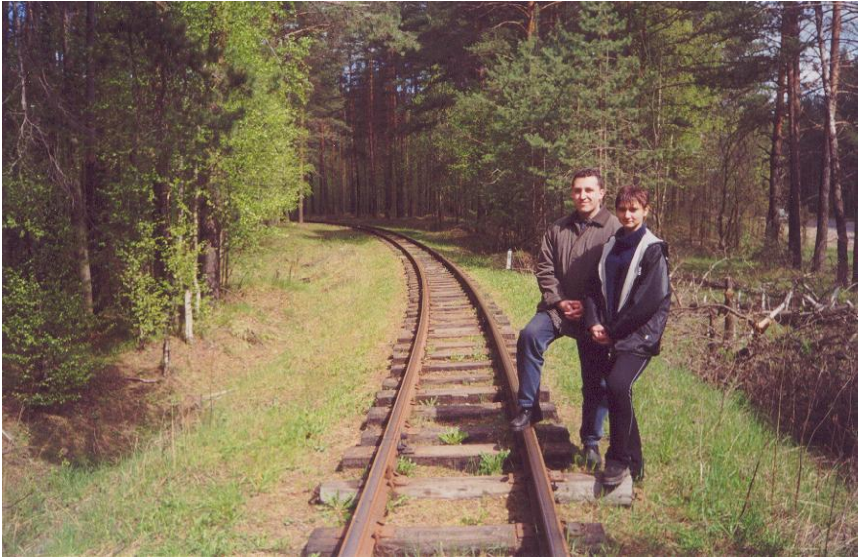
лесовозная узкоколейная железная дорога