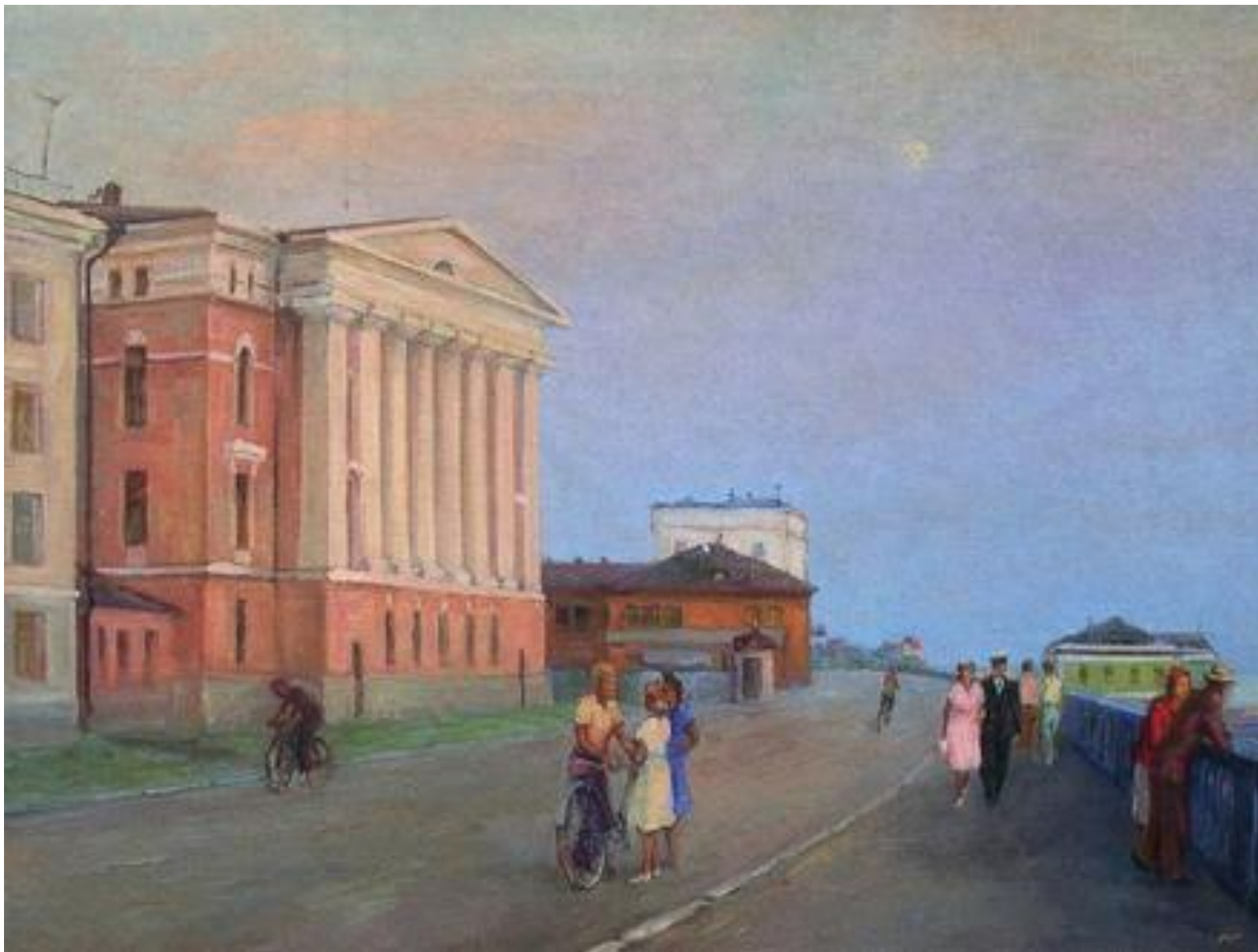
Г. В. Кононов «Архангельск. Набережная у ЦНИИМОДа»