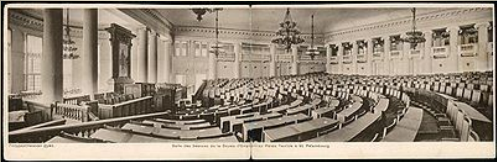
Зал заседаний Государственной думы в Таврическом дворце, Санкт-Петербург

В 1906—1910 годах интерьеры здания изменили в связи с размещением в нём Государственной думы (архитектор П. И. Шестов).