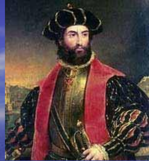
Путешествия Васко да Гама и Фернана Магеллана