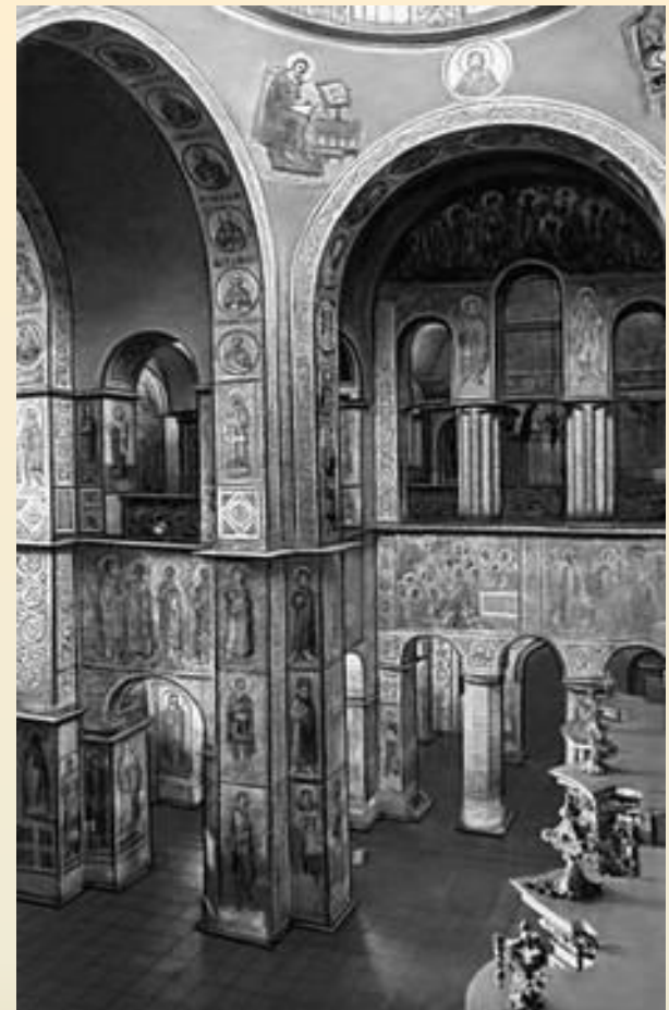
Софийский собор в Киеве, 1037г.