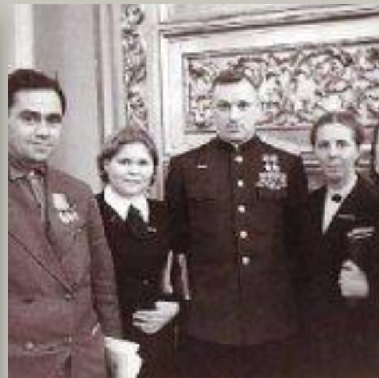
Делегаты Верховного Совета