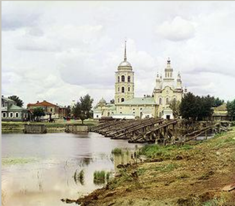
Шадринский уезд 1910г.

Родился в бедной крестьянской семье 29 октября (10 ноября) 1895 года в селе Мальцево (Шадринский уезд Термской губернии, ныне Шадринский район Курганской области).