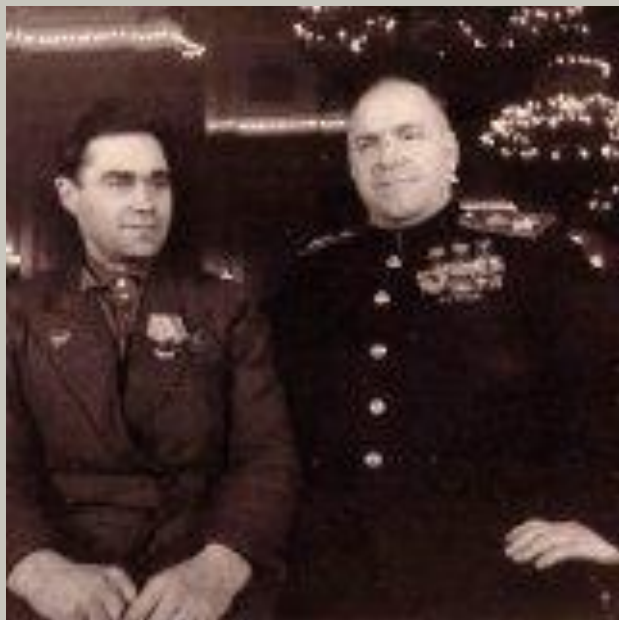
Т. С. Мальцев и Г. К. Жуков

Мальцев участвовал в девяти съездах партии, почти полвека был депутатом Верховного Совета РСФСР и СССР. Терентий Семенович умер 11 августа 1994г.