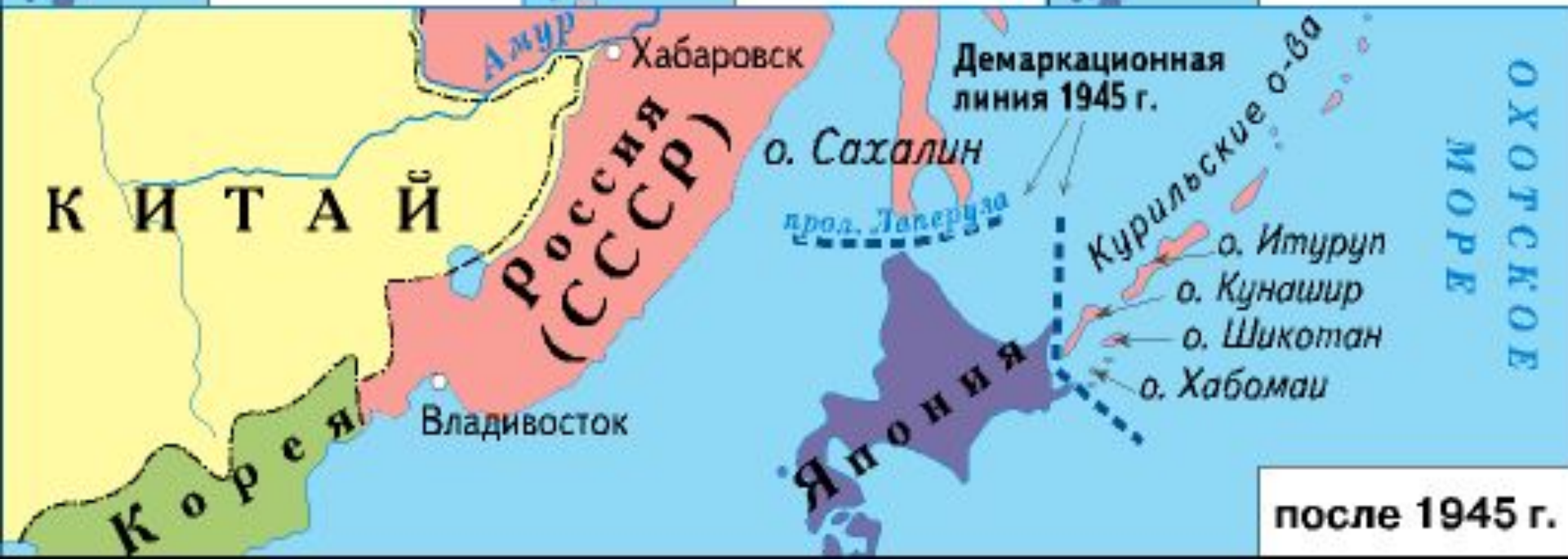
после 1945 г.