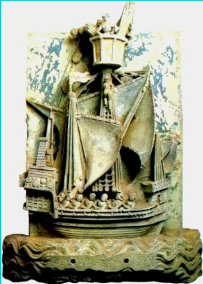
Морская торговля. Барельеф 14 века.

Несмотря на натуральный характер феодального хозяйства, торговля не только не исчезла но и приносила прибыль.