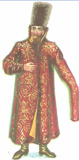
Боярин в опашне