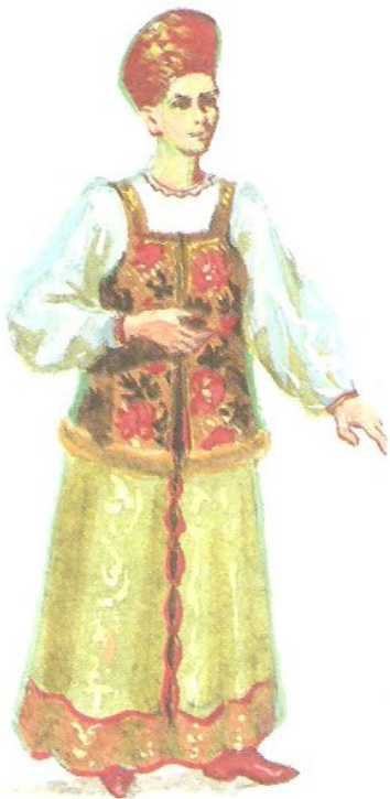
Женщина в сарафане и душегрее