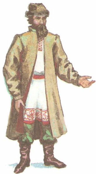
Мужик в рубахе, кафтани, портах и сапогах