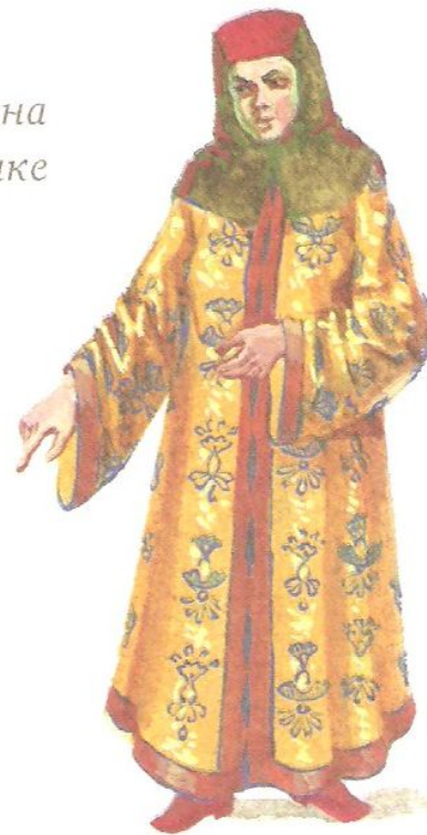
Женщина в летнике