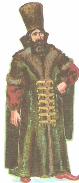
Боярин в шубе и горлатной шапке