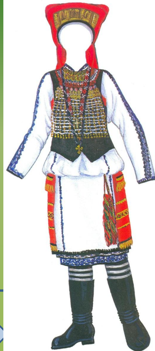
← Костюм невесты-мокшанки