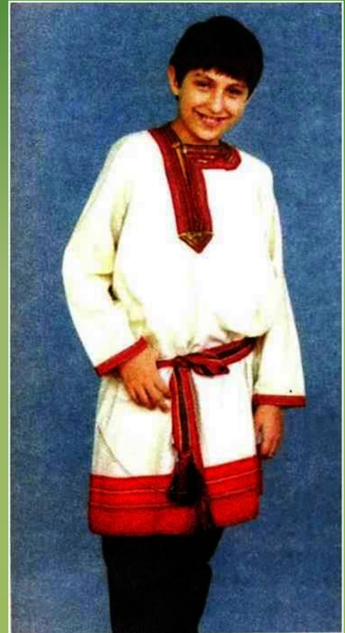
Мужская рубаха – панар